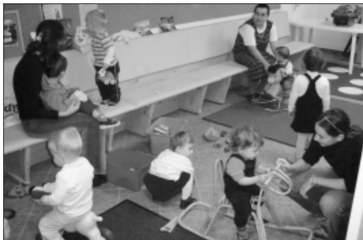
Nem ritka, hogy egy-egy vasárnap húsz-huszonöt kicsire is vigyáznak a gyermekmegőrzős testvérek