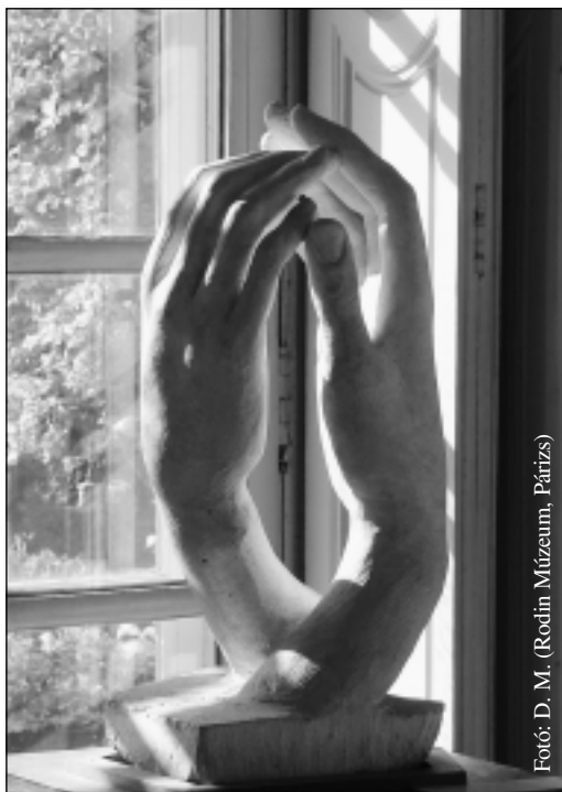
Fotó: D. M. (Rodin Múzeum, Párizs)

Hordozzuk egymás terheit: vajon hatvan ember le tud-e úgy ülni egymás ölébe, hogy mindenki támaszkodhat valakire?