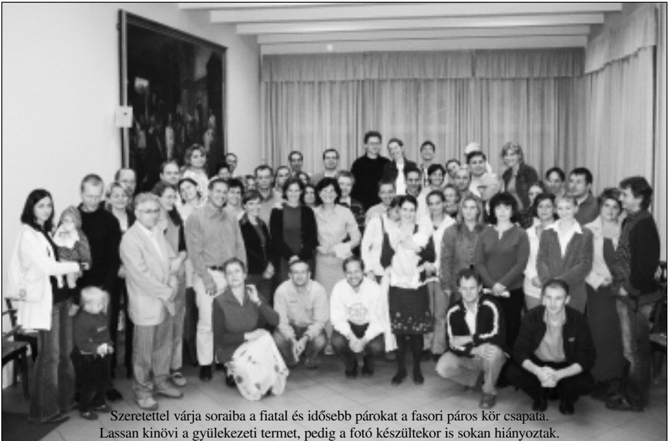
Szeretettel várja soraiba a fiatal és idősebb párokat a fasori páros kör csapata. Lassan kinövi a gyülekezeti termet, pedig a fotó készítő is sokan hiányoztak.