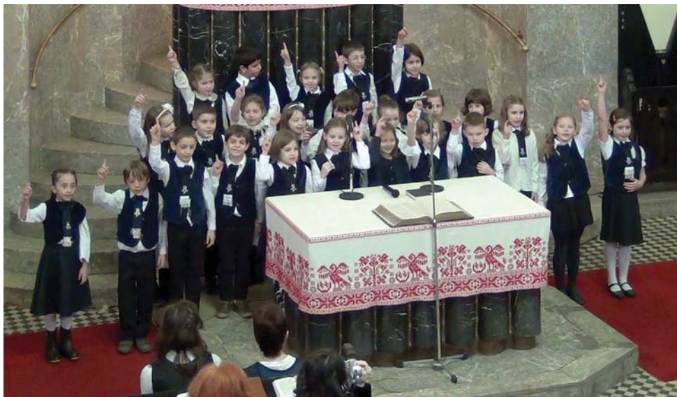
Juliannás diákokkal és szüleikkel telt meg templomunk november 16-án (Fotó: dr. Bartha Csaba)