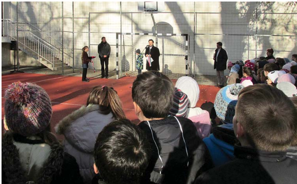
A Julianna iskola felújított udvari sportpályájának ünnepélyes átadása november 20-án