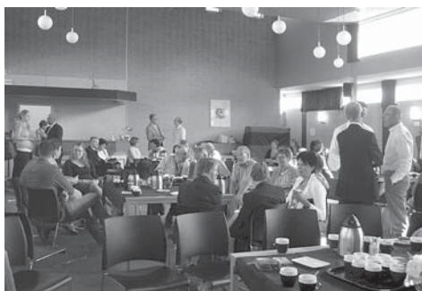
Életkép az alkalmak szünetéből

Életemnek egy meghatározó, áldott hetét tölthettem szeptemberben a hollandiai Papendrechtben működő testvérgyülekezetünkél. Ez évi meghívásukra 21 gyülekezeti taggal indultunk egy nagyon esős szeptemberi hajnalon Ferihegyről. Mivel ez volt első repülőutam, már a repülés is felejthetetlen élmény volt számomra. Eindhovenben leszállva ragyogott a nap, a repülőtéren gyönyörű szép idő várt minket, és egy nagyon kedves ottani gyülekezeti lelkész. Érezhető volt, hogy ez a hét Istennek tetsző dolog lesz. Busszal mentünk Papendrechtbe, ahol a gyülekezet temploma, a Sionskerk előtt nagy-nagy szeretettel fogadtak a holland testvérek. Szeretettelgességgel készültek, ezen már azt leshettem, hogy mit tudok majd hasznosítani itthoni alkalmainkon. Ismerkedtünk, beszélgettünk, mindenki egyenként bemutatkozott. A holland testvérek kétnyelvű énekeskönyvvel is készültek az alkalmakra, jó volt így, együtt dicsérni a mi Urunkat.