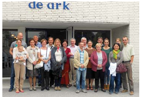
A fasori csapat