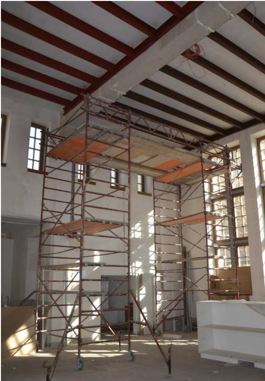
Készül a fasori kollégium új tornaterme

Rengeteg szervezői-tervezői, menedzseri munka van az építkezés mögött, számtalan megbeszélés, levelezés, egymásnak feszülés a kivitelezővel, és hangsúlyosan szeretném megköszönni mindenkinek a szolgálatát, munkáját, aki ebben a gyülekezet részéről feladatot vállalt. Hisszük, hogy az építkezés befejezése