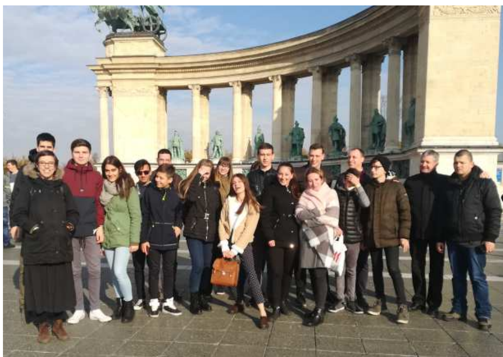
Városnézés közben a Hősök terén