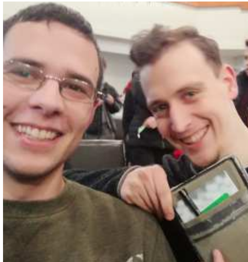
Egy gyors selfie a zilahi Kálvineumban

A konferencia témája a győzelem volt. A nyitóáhitaton Sámsonról volt szó a Bírak könyve 15,13–19 alapján. Jó volt újra hallani arról, hogyan győzhet le Isten segítségével egyetlen ember 1000 életerős férfit egy számár állsontjával, majd arról, hogy ezután amikor