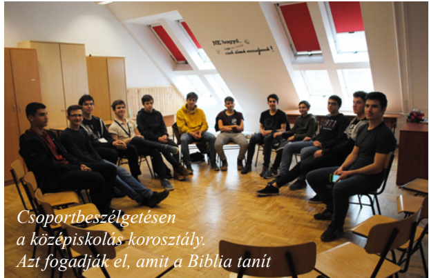
Csoportbeszélgetésen a középiskolás korosztály. Azt fogadják el, amit a Biblia tanít