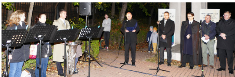
Megemlékezés a Reformáció parkban. De jó lenne, ha annyian ünnepelnénk, hogy megállna a forgalom!