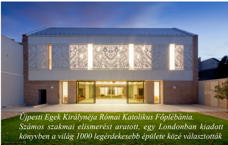
Újpesti Egek Királynéja Római Katolikus Főplébánia. Számos szakmai elismerést aratott, egy Londonban kiadott könyvben a világ 1000 legérdekesebb épülete közé választották

kialakult az adott helyzetben a benne munkálkodók között, a közös végcél érdekében. Ezek egyike volt a plébánia átköltöztetése. Az épületben a zeneiskola működött korábban, amely szintén megfelelőbb helyre talált. Igazán különlegessé a munka számomra mégis inkább attól vált, hogy a teljes folyamat alatt szinte végig tapintható volt Isten jelenléte. Az épület elsöre nem látszott túlságosan alkalmasnak erre a célra, de ahogy elkezdtem megismerni, kibomlott előttem a benne rejlő lehetőség. Az épület tervezése szépen és problémamentesen alakult. A gyülekezet felvázolta az alapvető igényeit, de minden egyébben szabad kezet adott. Követték és támogatták az elképzeléseimet. A kivitelezés aztán rendkívül problémássá vált. A munkát elnyerő kivitelezőt le kellett váltani, amiből még per is kerekedett. Úgy tűnt, hogy ebből az épületből semmi sem lesz. Viszont mindig továbbléphettünk egy-egy lépéssel. Újrakezdünk, végül nem kis csodaként el is készült, amit nagy örömmel és növekvő létszámban használ a gyülekezet azóta is. A plébánia épületének legfontosabb üzenete, hogy egy épületnek, ami nem templomnak épült – ráadásul egy régi épület átalakításával jött létre – meg lehet teremteni a szakrális