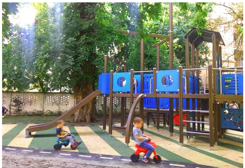
Ilyen az, amikor otthon vagyunk „Istenünk házában udvarában”

Őszinte vallomásként el kell mondanom, hosszú időn át úgy mentem haza az óvodából, hogy holnaptól nem jövök ide vissza, és mindennap meg kellett küzdenem az újrakezdésért. De végül az idegen földről „Isten népe visszatért hazájába” (Ézs 35). Igen, igazi