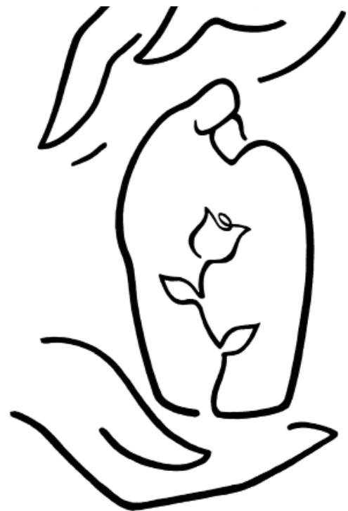
Gondviselés. Simon András grafikája (cikkszám: 1366; a szerző engedélyével)