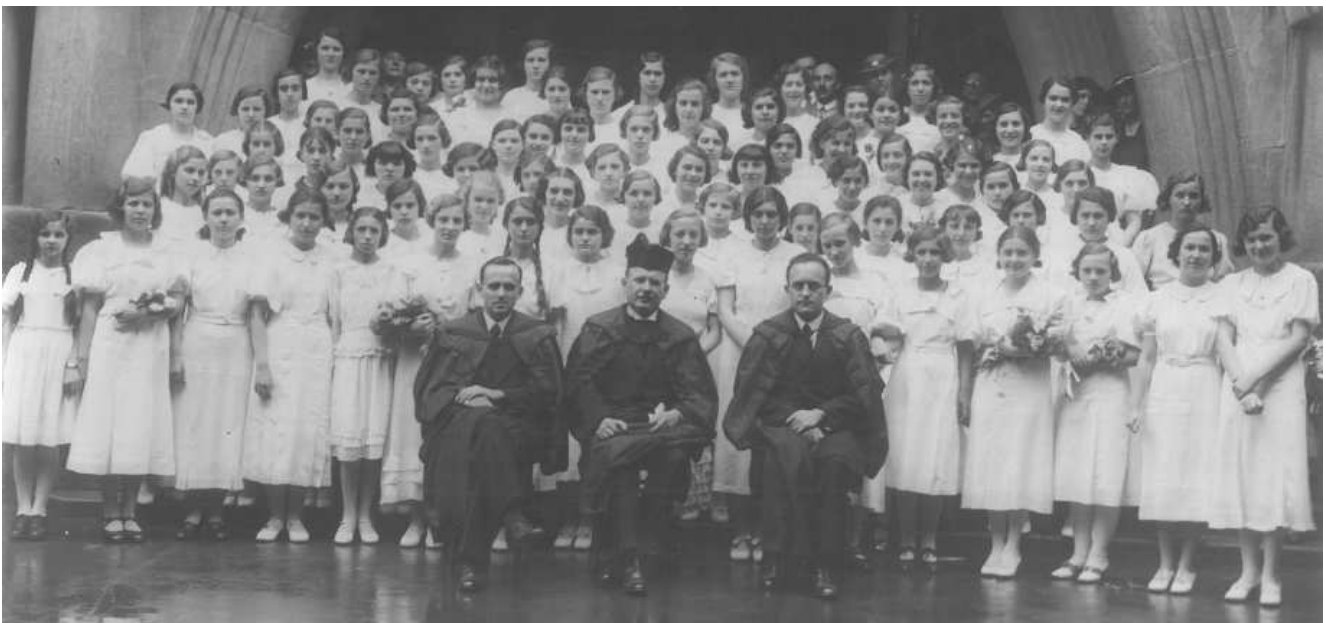
Eta néni konfirmációs képe 1936-ból gyönyörű fasori templomunk bejáratánál