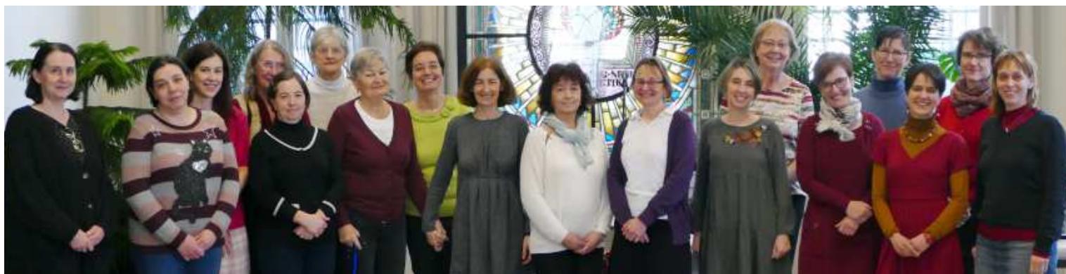
Idén is összegyűltek a presbiterfeleségek – „Felelősek vagyunk Isten ránk bízott világáért.”