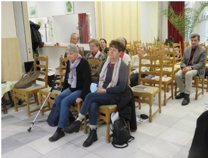
A résztvevők egy csoportja az idei Diakóniai Napon