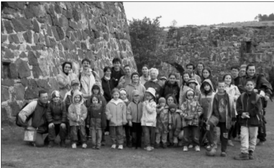
Családos kirándulásunkon Pilisborosjenő határában meglátogattuk az Egri csillagok című film forgatásához felépített vár romjait. Jókedvünket a néha megeredő eső sem tudta elvenni. Isten kegyelméből szép délutánt töltöttünk együtt.