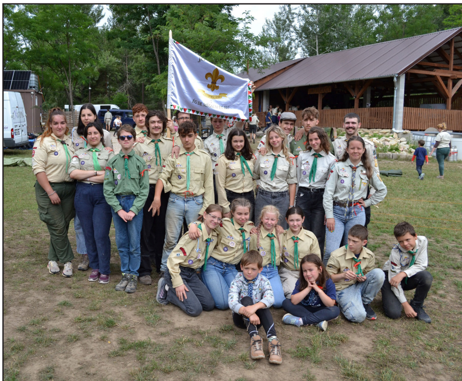
Csoportkép a 2025-ös cserkész tábor résztvevőiről