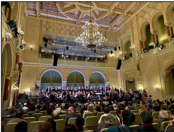
A Vigadó koncertterme - Megjelent a zenében Jézus szelídsége és szeretete, kiszolgáltatottsága....

A vállalkozás mérete is mutatja, hogy a zeneszerző munkáját a Szentlélek ihlette és segítette az alkotás útján, az előadás alatt pedig érezhető volt a Szentlélek jelenléte. Megjelent a zenében Jézus szelídsége és szeretete, kiszolgáltatottsága, és megjelentek a világ bűnei, hogy aztán a nagy mű végére világossá váljon a hallgatóság számára, Nietzsche istentagadó kijelentésével szemben Isten van, és él, Jézus él, és velünk van. S ahogy az utolsó hangok elhagyták