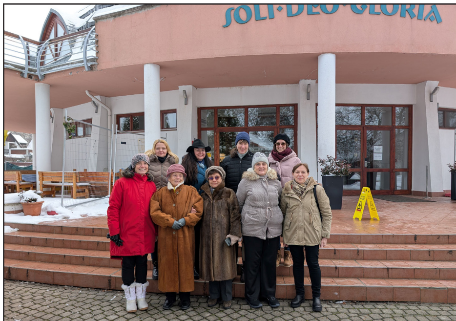
Csoportkép a Tanúim lesztek tanfolyam balatonszárszói hétvégéjén résztvevő testvérekről - A szervezés Isten által tökéletesen időzített volt -