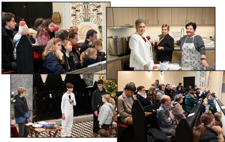
Advent 4. vasárnapján a konfirmandusok szolgálata a templomban - A gyülekezeti nap közös ebéddel folytatódott, majd gazdag délutáni programmal.