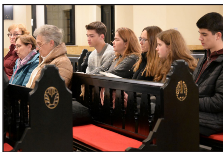
A gyermekek után egyértelműen megemlíthetjük a fasori ifjúságot, mint ránk bízottakat.

vagy teológiai képzési szolgálatba állítja, akkor bűn lenne ebben nem részt venni. Fel kell ismernünk és el kell fogadnunk, még ha ez esetleg hiányérzettel is jár, hogy a mi gyülekezetünk nemcsak a közvetlen evangelizációs sorozatokkal, mint a Keresztkérdések járul(hat) hozzá az Isten országának