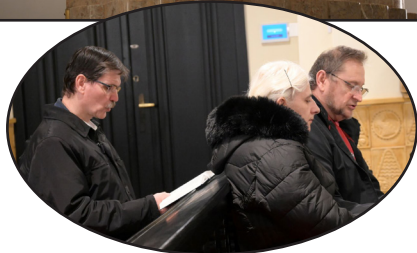
Adventi előkészítő alkalmak a templomban