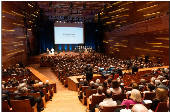
A pécsi kultúrpalotában ünnepelte a Dunamelléki Református Egyházkerület a Hercegszöllősi Kánonok elfogadásának és kihirdetésének 450. évfordulóját.

mátus egyháztörténet egyik legfontosabb eseménye, amely a török hódoltság idején határozta meg a Dél-Baranya és a Szerémség református közösségeinek életét. Ötven évvel a mohácsi nemzetvesztés után, a török hódoltság idején Veresmarti