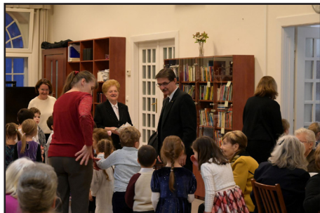
A nyugdíjasok délutánján a nagycsoportos óvodásaink is szolgáltak.