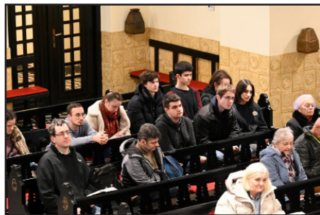
Testvérek a hitmélyítő héten 2026 Húsvétjára várva

Mire fordítjuk a bevételeinket? A költségek két nagy részből tevődnek össze, ezek kb. háromnegyede munkatársaink javadalmazása, egynegyede pedig a templom és a parókia fenntartása, üzemeltetése, a rezszi és a modernebb eszközeink, gépészeti berendezéseink karbantartása. A béreket évről évre szeretnénk rendezni, igazítani a világi közegben sok helyen már alkalmazott szinthez, de ez 2025-ben sem sikerült olyan mértékben, mint ahogy terveztük év elején. Az igazgatási és fenntartási költsé-