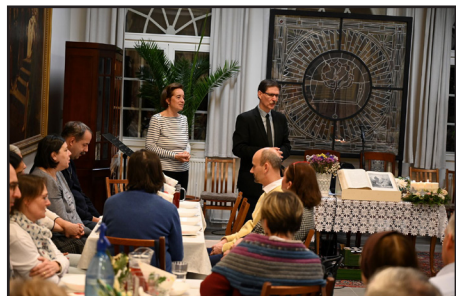
Szolgáltatvezetők karácsonyi alkalmá - Hálát adunk értük, akik idejüket, erejüket, segítségüket mások javára adják.