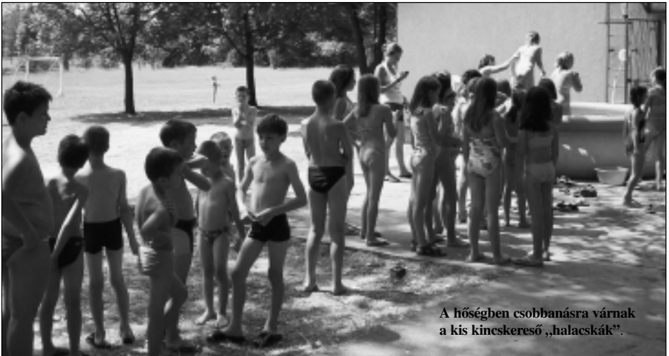
A hőségben csobbanásra várnak a kis kincskereső „halacsák”.

csodát tett és megváltott: elvégezte mindazt, amivel megbízta őt az Atya. Ezt a lehetőséget a Péter életéről szóló történetekkel ragadtuk meg a Bibliából. A címe is így hangzik: Péter az evangéliumban. Hítünk szerint Isten áldása azért nyugodott meg rajtunk, mert mindenben Jézus tanítása szerint igyekeztünk eljárni. Sokan, sokszor tusakodtunk, könyörögtünk a táborért, szolgáló munkatársakért – mi magunkért –, úgy, ahogyan ezt Jézus is megcselekedte a tanítványok kiválasztása előtt: imádkozva átvirrasztotta az éjszakát (Lukács 6, 12–16). Szolgáló közösségként pedig már a készülés, a tervezés időszakában engedtünk a felülről való vezetésnek – tudván, hogy Jézus Krisztus Egyházában maga a Szentlélek a vezető. Ezért a reggeli és az esti vezetői megbeszélések, az imaközösségek a táborban is minden nap lehetőséget teremtettek arra, hogy hitbeli engedelmességben kérjünk el mindent az Úrtól, és mindenért neki adjunk