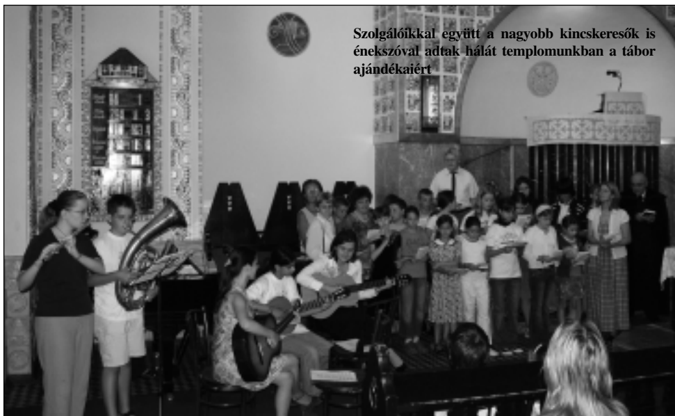
Szolgálókkal együtt a nagyobb kincskeresők is énekszóval adtak hálát templomunkban a tábor ajándékaiért

tartozásunk kifejezésére, melyet kicsik és nagyok egyaránt méltósággal teljes, ünnepélyes pillanatként éltek meg.