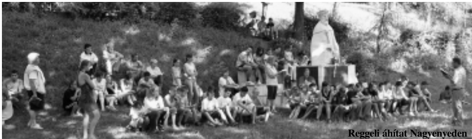
Reggeli áhítat Nagyenyeden

Reménységet tanulni – ez volt Isten célja a honismereti táborunkkal július 22–29. között. Erdélyben, a híres nagyenyedi Bethlen-Kollégiumban laktunk egy hétig hetvenhármán az egy haza hét régiójából, jórészt régi ismerősök. Reggeli sorozatunk a szeretet tulajdonságai voltak az I. Kor. 13-ból, esténként az imádság és imádkozás csodáit hallgattuk Jézus tanításából. Amikor a 29-i, vasárnapi igehirdetésre készültem, még nem tudtam, hogy az Úr mivel fog meglepni bennünket. Vártemplomi prédikációm textusa a Főpapi imából (János 17) a 15. vers volt: „ Nem azt kérem, hogy vedd ki őket a világból... ” Egy hét alatt megértettük, mit jelent a világban élni Isten akarata szerint. Sok szépet láttunk a természetben és a délerdélyi építészet csodáiban. A torockói Székelykő, a tordai hasadék látványa lenyűgözött, Kolozsvár és Gyulafehérvár épületei történelmünk kőbe faragott csodái. Magyarlapád a népi hagyományokat szerettette meg velünk, Válaszút pedig Wass Albert gazdag életéről mesélt. Ám Dél-Erdély legtöbbször nemzetünk pusztulásának szívszorító krónikáját tárja az odalátogató elé. És mégis ...Bod Péter egykori várában ki-