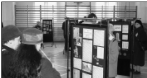
Bibliatörténeti kiállítást láthattunk a Julianna iskola tornatermében

Az idei Kálvin Kalendáriumban található ez a megállapítás: „A Biblia messzeemenően emberi dokumentum. Számos tévedést, ellentmondást sőt gonoszságot találunk benne. Morális szempontból is sok