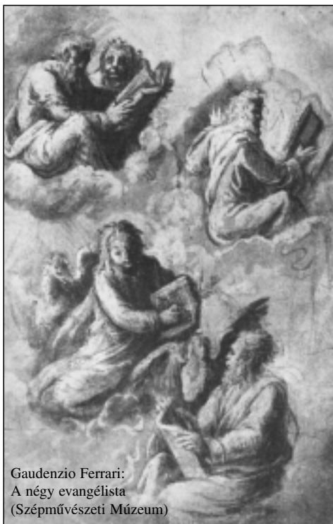
Gaudenzio Ferrari: A négy evangélista (Szépművészeti Múzeum)

zus földi születése előtt is létezett. Ezt a legki- fejezőbben János adja elő. Evangéliuma je- lekről is beszámol. A megtörtént esemény mindig jelez valamit. A 2. részben a kánai menyegző arra tanít, hogy Jézus messiási küldetését nem lehet felgyorsítani. A 14. és 16. részben Jézus elbúcsúzik tanítványai- tól, és bátorítja őket.