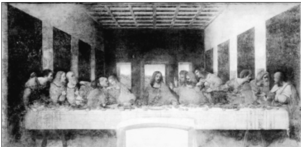
Leonardo da Vinci: Az utolsó vacsora

gyek, mint az aranygyűrű, amelyet az uralgó feleségének ad: anyaga nem változik, mégis önmagán túlmutató jelentősége lesz, hisz az ajándékozó szeretetét juttatja a megajándékozott eszébe.