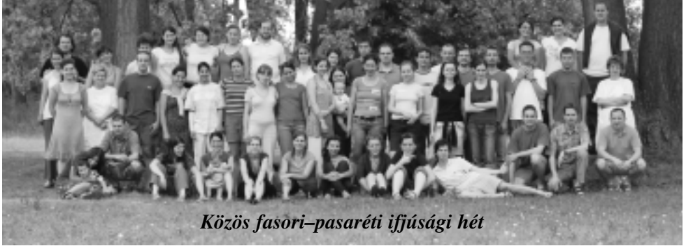
Közös fasori–pasaréti ifjúsági hét