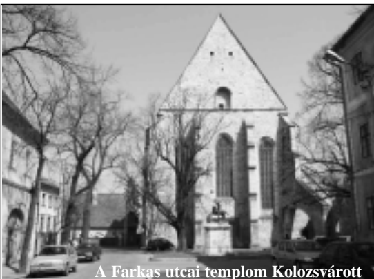
A Farkas utcai templom Kolozsvárott