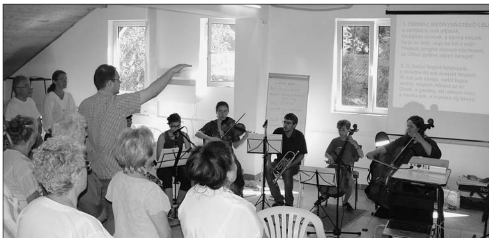
Zenei szolgálat közben Sátoraljaújhelyen

– A gyülekezet organikus közösség, ami egyfajta zártságot feltételez, ám emellett nyitottnak is kell lennie. Ez az, amiben fejlődniünk kell. Hogy azokat is, akik még nem tartoznak ide, Istenhez vonzzuk befogadó szeretetünkkel. Legyünk „hegyen épült város”, de olyan, aminek nyitva vannak a kapui, olyan, ami a világ szellemiségét nem engedi be, de a világ embereit igen. Mert ez a feladatunk,