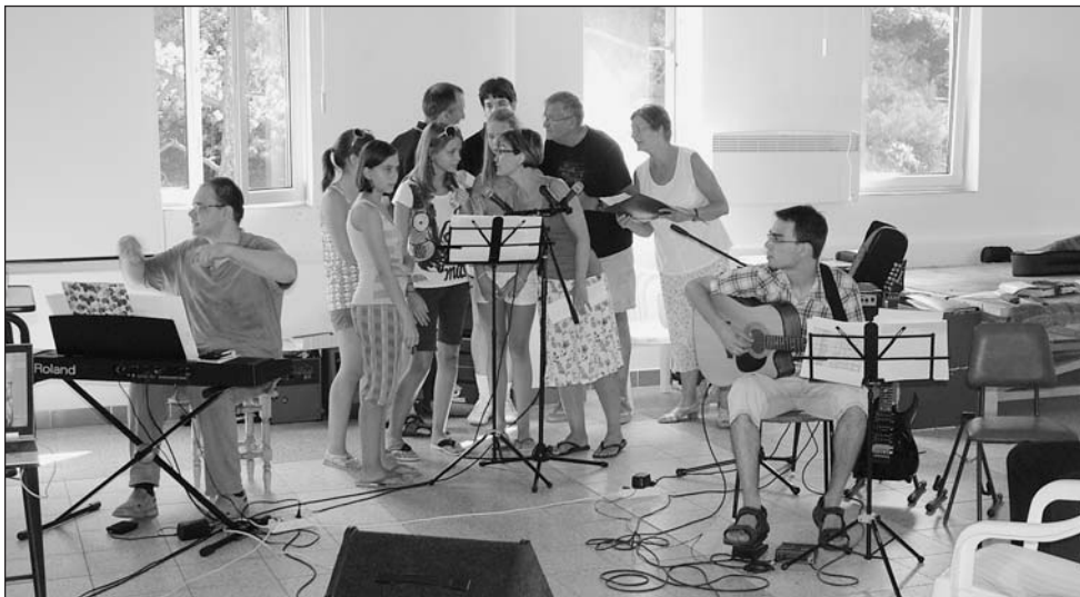
Éneklésre készül a kórus

ezért építi Isten ezt a várost, hogy legyen hová befogadnia azokat, akik vágynak az Ő országába tartozni.