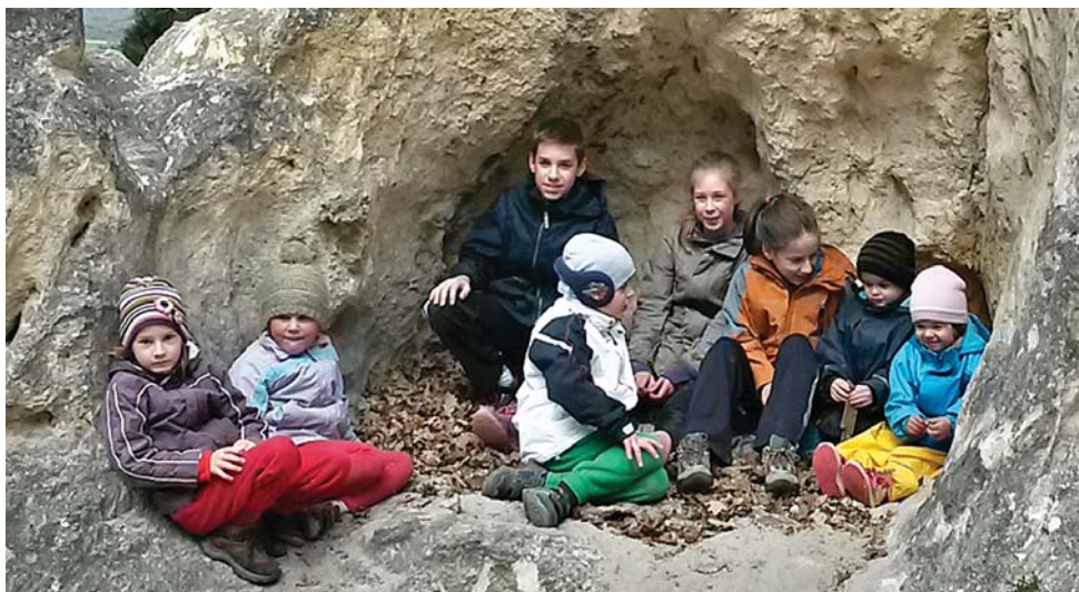
Bár az időjárás inkább őszi volt, mégis egy vidám tavaszi napot tölthettünk együtt Budaörsön április 18-án, az éves gyülekezeti kiránduláson