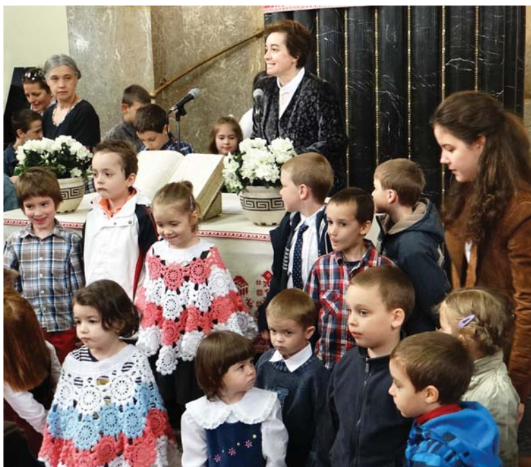
Május 3-án a gyülekezetbe járó családok gyermekei köszöntötték édesanyjukat anyák napja alkalmából