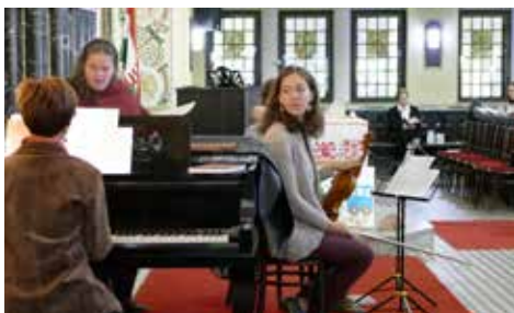
Zenei szolgálat a 2016-os női csendesnapon

Érzelemdúsabbak a nők? – tettük fel a kérdést az áhítat során. A tapasztalat és az agykutatás is egyértelműen alátámasztja ezt. A nőknél az agy egészében növekszik az aktivitás az érzelmek feltörésekor. Ezenkívül mindenre az érzelmeinkkel reagálunk. Ezek felszakadnak bennünk, zuhatagként elárasztanak, betöltenek, túlcsoordulnak, és elmondjuk, akinek csak tudjuk, hogy mit érzünk. Az emotion angol szó az ex movere latin kifejezésből ered, melynek jelentése: 'kimozdít', 'arrébb mozdít'. Merre visznek minket az érzelmeink? Mária énekét olvastuk a Lukács 1,46–55. szakaszból. Példa volt előttünk az Úr földi édesanyja, akiből a hála, öröm, boldogság, magasztalás, megelégedettség fakad fel. Természetes ez? Hiszen életveszélyben van abban a korban, mert házasság nélkül gyermeket vár. A Szentlélek által történik Jézus Krisztus születése, de ez a hitetlen ember szívének, szemének érthetetlen. Tele lehetne kérdéssel, panasszal, miérttel, aggódással, békétlenséggel. Mária azonban példa abban, ahogy dönt. Istenre, a szavára, kijelentésére, az ígéreteire fog hallgatni. Nemet mond az aggodalmaira. Mi ráállunk-e Isten szavára? Eljutott-e Isten magasztalásáig, az Úrban való örömg,