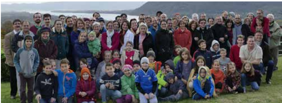
Presbitereink családjaikkal a felvidéki Kovácspatakon októberben két napot töltöttek el az Ige mellett