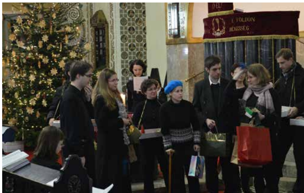
Fiatalfiaink tavalyi adventi szolgálata

– Ingyen megkaphatja. Az igazi ára megfizethetetlen. Ha egész életében erre gyűjtene,