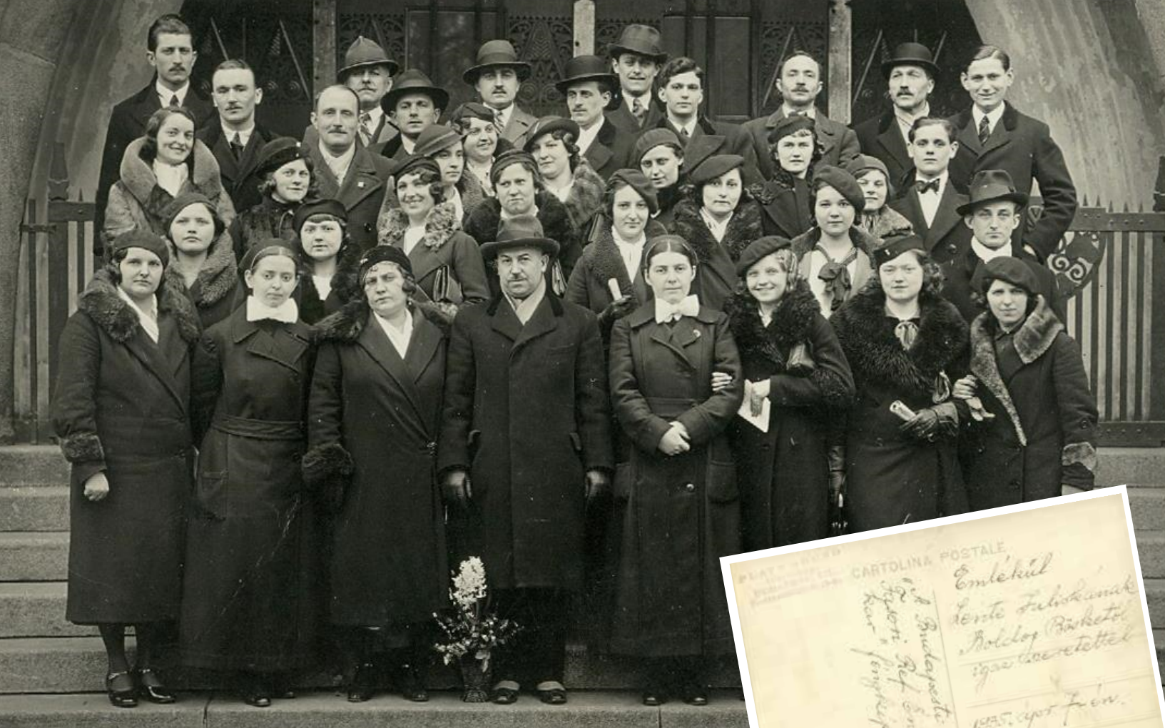
A Fásori Református Gyülekezet énekkara 1935 körül Képes levelezőlap