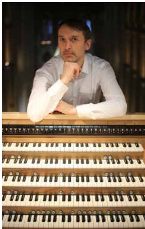
Olivier Latry orgonaművész