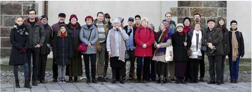
Fasori Testvéreink a Schlosskirche előtt

nyörű, régi városrészben, közben többször végignéztük a 95 ajtót, ahogy gyermekek és fiatalok fogalmazták meg a reformáció mai üzenetét. Örömmel találkoztunk kávé, süti mellett egy helyi gyülekezeti taggal, aki a mai gyülekezeti életről beszélt. Szintén gyülekezeti tag mutatta meg és értelmezte számunkra a Stadtkirche Lucas Cranach-festményeit. Itt vettünk részt vasárnap istentiszteleten is. Végül hadd adjuk át ajándékként a gyülekezet számára rövid lelki gondolatainkat, melyeket egy-két mondatban fogalmaztunk meg a résztvevők. Milyen üzenetet kaptunk a Wittenbergi hétvégén?