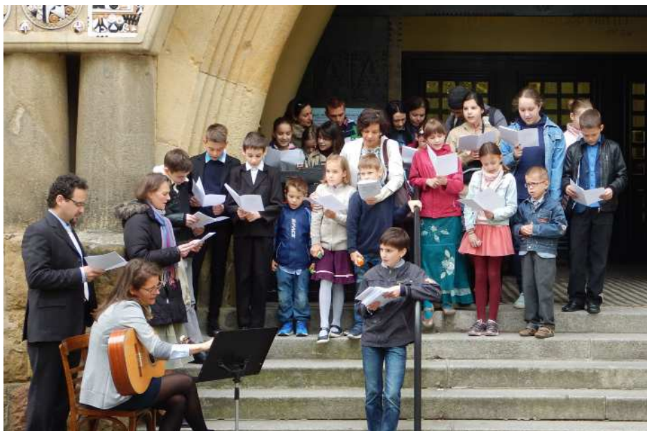
Énekszó köszöntötte húsvétkor a templomba érkezőket