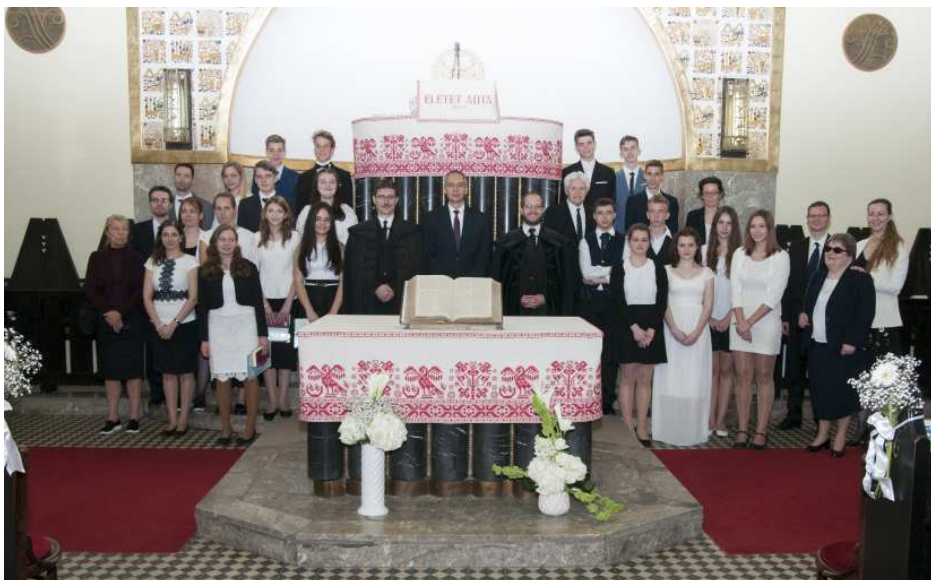
Május 28-án 17 fiatallal és 7 felnőttel bővült gyülekezetünk a konfirmáció ünnepélyes fogadalmókétele nyomán