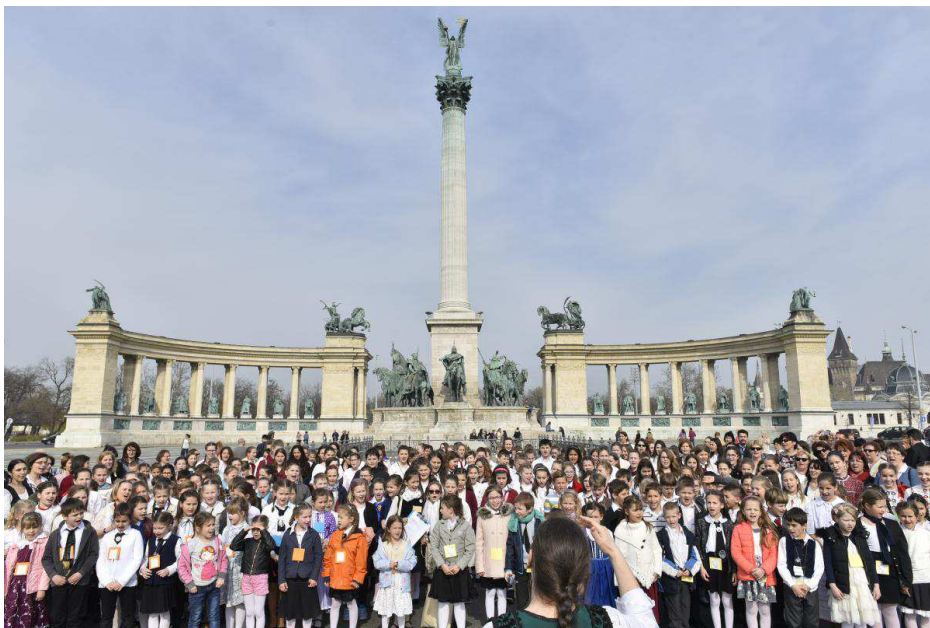
A résztvevőkből szerveződött összkórus a Hősök terén

A verseny egyben lelki alkalom is mindig. A reformáció 500. évfordulójának alkalmából egy különleges élménnyel is megleptük versenyzőinket: a Hősök terén egy páratlan flashmobot szerveztünk számukra, s a közös éneklésről tévéfelvétel is készült. Külön öröm volt számunkra, hogy idén a felsős, csoportos kategóriában iskolánk tanulóinak ítélték oda az első helyet. Remek verseny volt csodálatos hangú gyerekekkel! Reméljük, jövőre újra találkozunk!