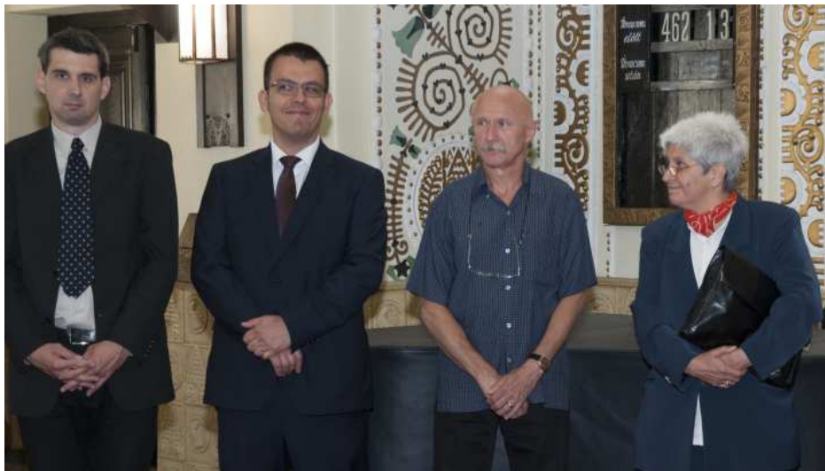
Nagy örömminkre sok jubiláló konfirmandus is eljött a május 28-i konfirmációi istentiszteletre: képeinken a 25 és 50 éve templomunkban konfirmált testvéreink.