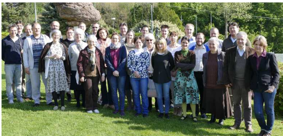
Fasori presbiterek és szolgálatvezetők Kovácspatakon

A szolgálói hétvége egyik nagy tanítása az volt, hogy minden dolgunk térden állva dől el. Akkor, amikor alázatosan térdet hajtunk az Úr előtt, imádkozunk, engedjük, hogy az Ige fényében megfürdjünk, s az Úr Lelke átmosson bennünket, megtisztítson minden bűntől, s Tőle kérünk eligazítást minden ügyünkben, életünk minden eseményében. Imádkozom-e naponta, reggelenként? Hagyom-e, hogy az Úr rámutasson, ha valami nincs rendben az életemben? Mit tegyek le, mit hagyjak el, mi- ben induljak el? Kérem-e imádságban, hogy maga az Úr Jézus Krisztus tanítson? S ha