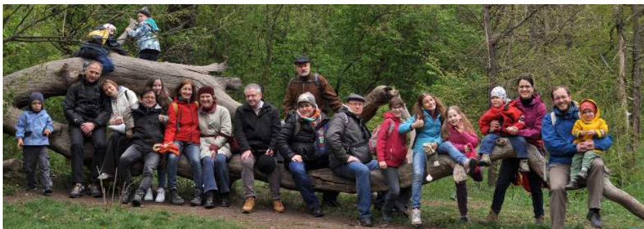
Fasor az erdőben