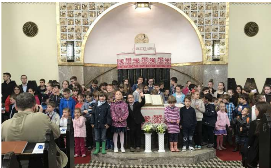
Szolgálattal készültek gyülekezeti gyermekeink anyák napján