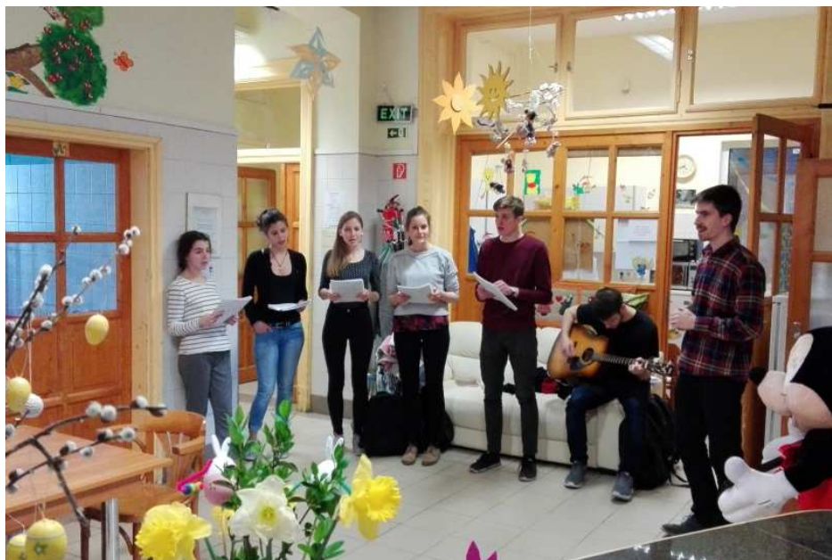
Fasori fiatalok szolgálata a Bethesda kórházban