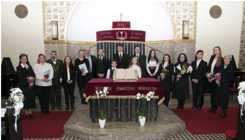
Február 19-én a konfirmáció keretében 9 felnőtt testvérünk tett tanúbizonyságot hitéről és elhatározásáról gyülekezetünk és Isten színe előtt