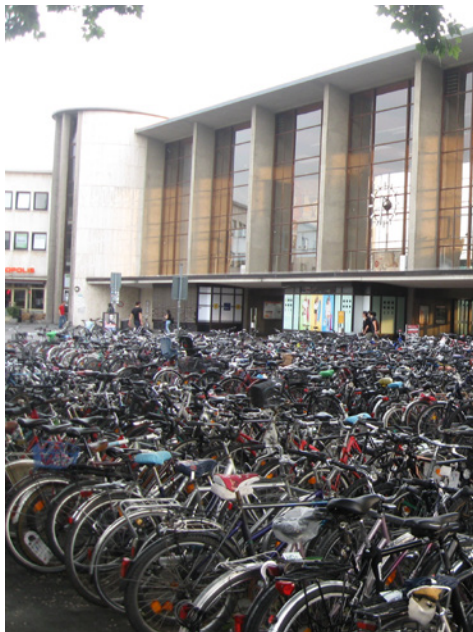
Heidelberg, egyetemváros: biciklirenetget a pályaudvar előtt

volt akadály, hiszen az oktatás latinul folyt. Az egyetem és a város fénykorában, 1560 és 1620 (a város katolikusok általi feldúlása és az egyetem átmeneti bezárása) között összesen közel 200 magyar diák tanult itt.