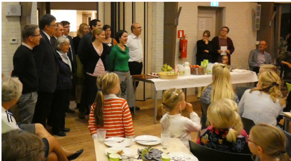
A magyar csapat énekel a hollandoknak

Különös élmény volt megtapasztalni, ahogy az alkalmakon elhangzott igei vezérfonál a gyakorlatban megvalósul a hét alatt. Az a be- és elfogadás, mellyel a holland testvérek szeretettel körülvettek minket, példaértékű. Mint az irgalmas samaritánus, aki mindenről gondoskodik. Emellett azt is jó volt átélni, hogy bár más országban élünk, az Úrban