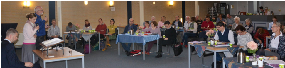
Igehirdetésre készülve a holland testvérekkel együtt a papendrechtli Sionskerk gyülekezeti termében

A nyelvi korlátok ellenére a házigazdáinkkal olyan mély lelki közösséget tapasztaltam meg, amilyen itthon többéves testvéri kapcsolatban sem mindennapos. Olyan sokféle lehetett volna ez a csendeshét a különbségek miatt, de az Úr egységet és örömet adott. Néhány konkrét gondolat, mely bennem megmaradt: intő példa volt számomra a jól ismert irgalmas samaritanus története. Ahogy meghallom, már tudom, mire kell gondolni, hogyan kell érteni, hiszen ismerem. Tényleg ismerem? Melyik szereplő a példa számomra? Na, arra sohasem gondoltam, hogy én lehetek a kifosztott és megsebesített ember. De akkor ki az irgalmas? Az pedig Jézus,