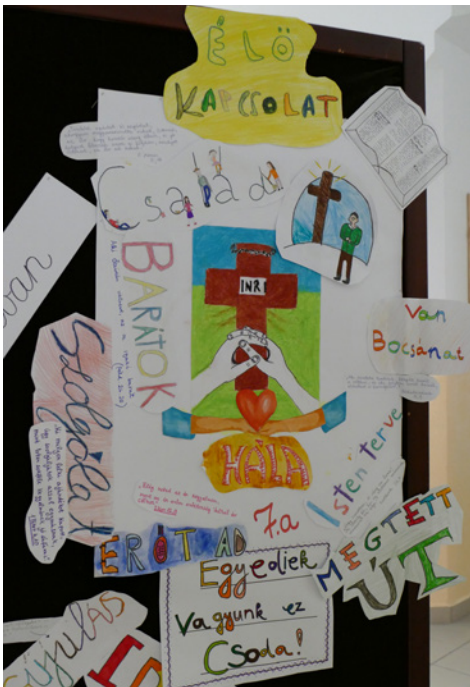
A csendesnapra készült egyik osztálymunka

Az október 1-jén tartott csendesnap témája János evangéliuma 14. fejezetének 6. verse volt: „Jézus így válaszolt: Én vagyok az út, az igazság és az élet; senki sem mehet az Atyához, csak énáltalam. ” Jézus Krisztus mondja: én vagyok az út. Ő az egyetlen, aki az életre visz, aki összeköt bennünket az Atyával, embertársainkkal, a mennyel. Jézus Krisztus megtette a legnagyobb és legnehezebb utat értünk. Élményeikről beszéljenek most a gyerekek! Három héttel a csendesnap után két kérdést tettünk fel nekik. A 4/b, valamint a 7/a és b osztály tanulóinak legtöbbször elhangzott válaszait olvashatjuk itt. Nagyon jó volt megtapasztalni, hogy szinte mindenki válaszolt!