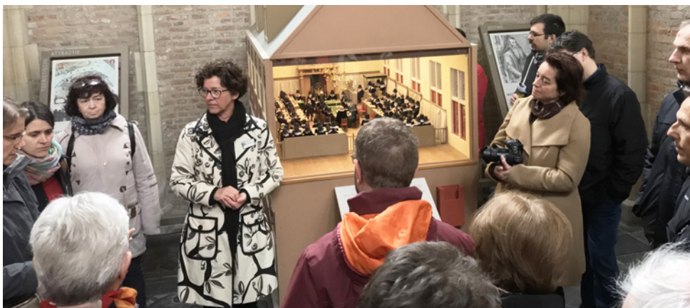
Kirándulás Dordrechtbe – az 1618–19-es, híres dordrechtli zsinat makettje a Grote Kerkben. A zsinatot a holland protestáns egyház szervezte, ekkor döntötték el, hogy a Bibliát lefordítják németalföldi nyelvre