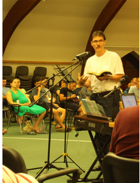
„Aki a Felséges rejtekébe költözhethet..” Az esti igehirdetés