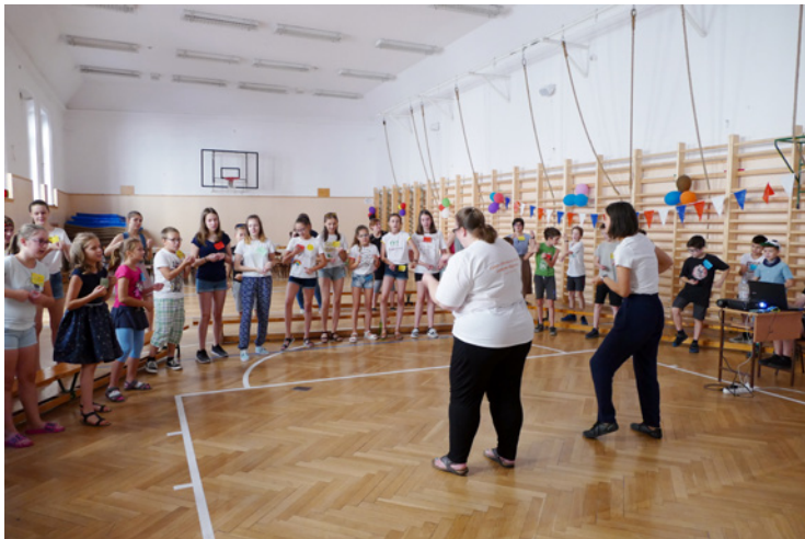
A résztvevők különlegesnek találták azt, hogy a bibliai tanítás is angolul folyt.

jó közösség alakult ki, s új embereket ismerhetett meg. A résztvevők különlegesnek találták azt, hogy a bibliai tanítás is angolul folyt, s lehetett egymástól is tanulni. Sokan sok helyről érkeztek, de a hét végére egységessé kovácsolta őket a tábor. Tetszett nekik a sok kreatív foglalkozás, de legfőképpen az, hogy közben barátságok