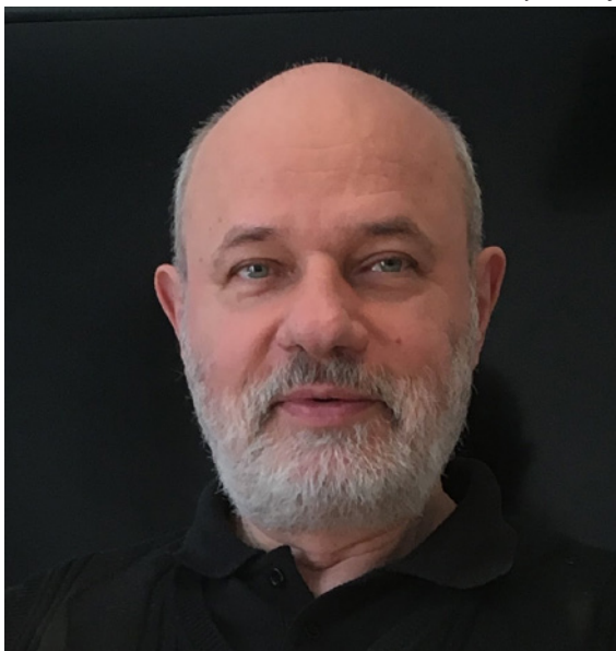
Egyre visszhangzott bennem: „Veled leszek!”