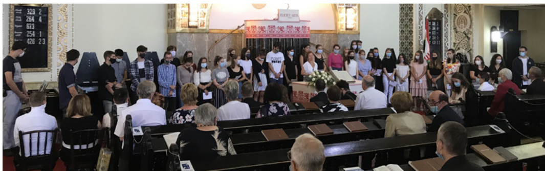
Ifihét után szolgáltak és bizonyoságot tettek templomunkban a fiatalok.