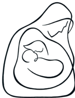
Szent család IV. Simon András grafikája (cikkszám: 1513; a szerző engedélyével)