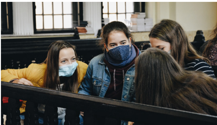
Idén mintegy 180 fiatal vett részt a Budapesti Református Ifjúsági Konferencián - Isten megáldotta