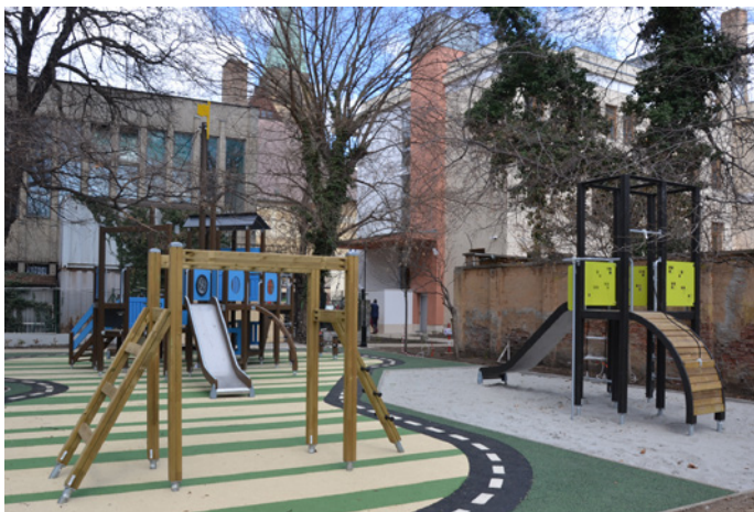
Hálás a szívünk, hogy a külső megújulás után a belső megújulás idejét is elhozza Urunk.

után, a belső megújulás idejét is elhozza Urunk, az új kihívások idején új lehetőségeket kaptunk személyileg és minden tekintetben. Intézményeink munkatársai is próba alatt vannak, jó látni, hogy a felszínre kerülő javítani való dolgok nem elrettentenek, hanem megerősítik eltökéltségünket. Gyülekezeti oldalról is, a Kollégium új vezetője, óvodánk új vezetője oldalról is olyan összehangolt