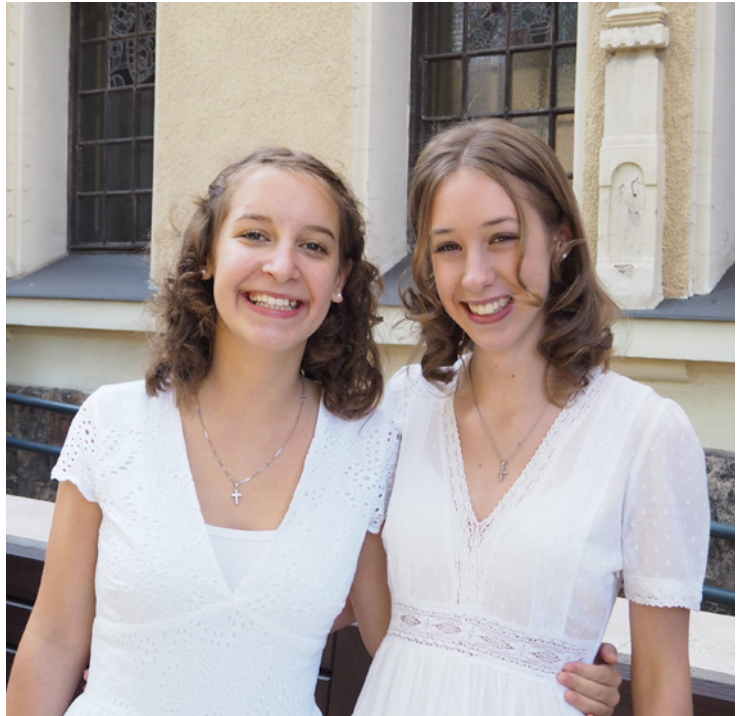
Hálásak vagyunk, hogy ilyen fiatalon elköteleződhattunk Isten mellett.