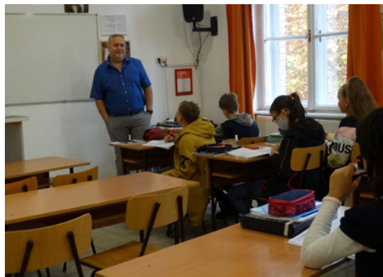
Diákjai körében- Az a jó, hogy Istenhez menekülhetünk