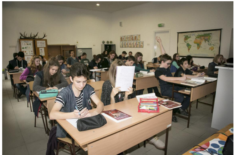
Nincsenek magas osztálylétszámok, ezért oda tudunk figyelni a gyerekekre

– Itt minden kollégával azonos értékrenden vagyunk, legyen az pedagógus, nevelési-oktatási munkát segítő irodán dolgozó vagy technikai dolgozó. Ez az azonos értékrend teszi lehetővé azt, hogy azonos irányba haladjunk, ugyanazt képviseljük és egy biz-