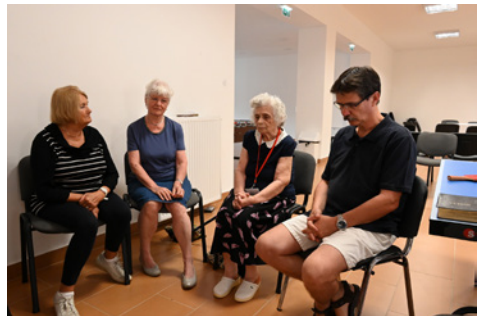
„Imádkozzatok és buzgón kérjétek!”