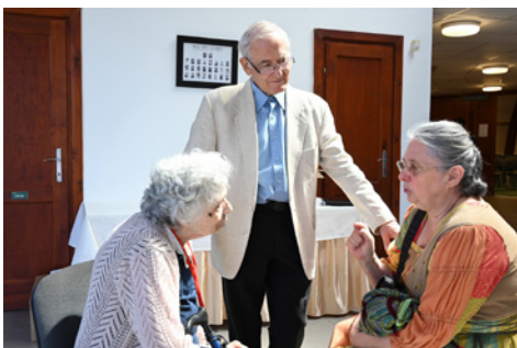
Az orvos előadónk válaszol

Kisebb gyülekezeti közösséggel már vettem részt csendesheteken, de ez az első, „nagy” gyülekezeti hetem. Ebben a csodálatos, pihentető környezetben valóban igaznak érzem az SDG jelmondatát: „Jó nekünk itt lennünk.” A pandémia ideje alatt meggyengült hitem megerősítésére jöttem el, hogy testvéri közösségben a testi-lelki állapotom „feljavításán” dolgozzam. A reggeli imaközösségek, a jó hangulatú közös reggeli tornák, a rendkívül aktuális témákat feldolgozó délelőtti és esti alkalmak, és az azokat követő pá-