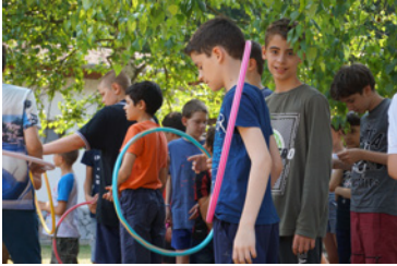
A szabadtéri programon mindenki örömmel vett részt

Reggeli előtt tornáztunk, utána pedig rendbe tettük a szobákat, játszottunk és énekelünk. A délelőtti központi része a csoportos foglalkozás volt, hat helyszínre vonultak el korosztályonként a gyermekek. József történetét