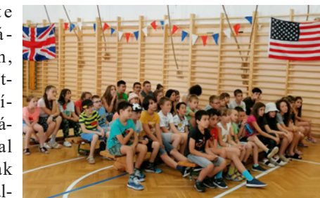
A résztvevők a dráma előadást nézik

Őszinte imádságaikban, köszönetnyilvánítással, hálaadással fordultak a Megváltó felé. Mindez bennünket felnőtteket mélyen megindított, hátalatt szívvel