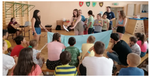
Bibliai történetet hallgatnak a gyermekek arról, hogy Jézus lecsendesíti a tengert