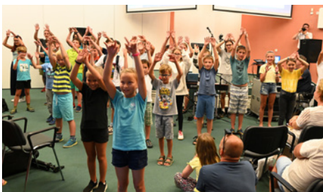
Az Ószövetség könyvei „fejben” és a kézművelkedésekben

imádság. Fialat, öreg, gazdag, szegény, barna, szőke, mind-mind együtt imádkoztunk a hajnali hűvösben hálát adva a napért, amit Isten adott. Hálát adva ezért a csodálatos hétért, ahonnan mi felnőttek és a gyermekeink is igazi kincsekkel és meglelégedéssel tértünk haza. SDG!