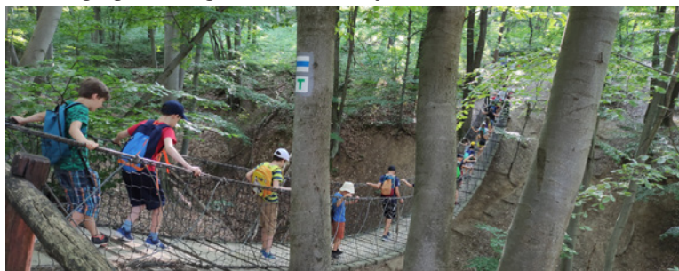
Átkelés a függőhídon

Számítottunk arra, hogy frissek és energikusak lesznek a gyermekek az elején. Őszintén meg kell mondjam, arra viszont nem, hogy az esti séta, majd az elhúzódó elcsendesedés ellenére