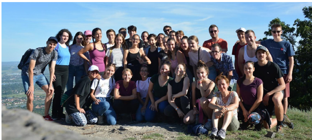
Lilla és fasori ifis társai