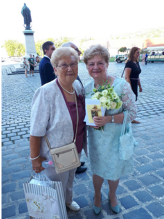
Marika barátnőmmel a bazilika előtt

lás szívvel elfogadtam. Hiszem, hogy nem véletlenül építette eddigi utamat, hogy tudás, tapasztalat, emberismeret és az éveim számával - szerénytelenségnek ne hangozzék - egyre több szeretet, bölcsesség, alázat, egymásra rakódjon és formálódjon Isten keze által azzá, aki lettem és aki vagyok mára. Most voltam június 28-án 70 éves, így hát amúgy is számot vetettem a sorsommal. Nem is tudom, hogyan éltem a Fasor előtti éveimben, hogy nem vettem észre, az Úr ott áll a résnyire nyitott ajtó előtt, mert zárva ugyan nem volt, de akkor még nem is tartam ki előtte. Utólag látom mindenütt az életemben, mennyire a tenyerén hordott, milyen óriási szeretettel és mérhetetlen kegyelmmel kísérte minden léptemet és alakított sikereken és a kudarcokon át, számtalan súlyosan nehéz terhet is rám rakva. Nélküle egyet sem tudtam volna elviselni, túlélni!