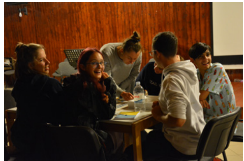
Az esti szabadidőben beszélgettünk, társasoztunk, pingpongoztunk, de az éjszakai túra sem maradt ki a programból.