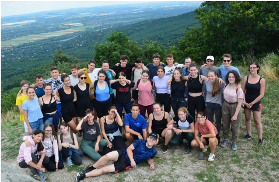
Minden emelkedőt legyőztünk :)