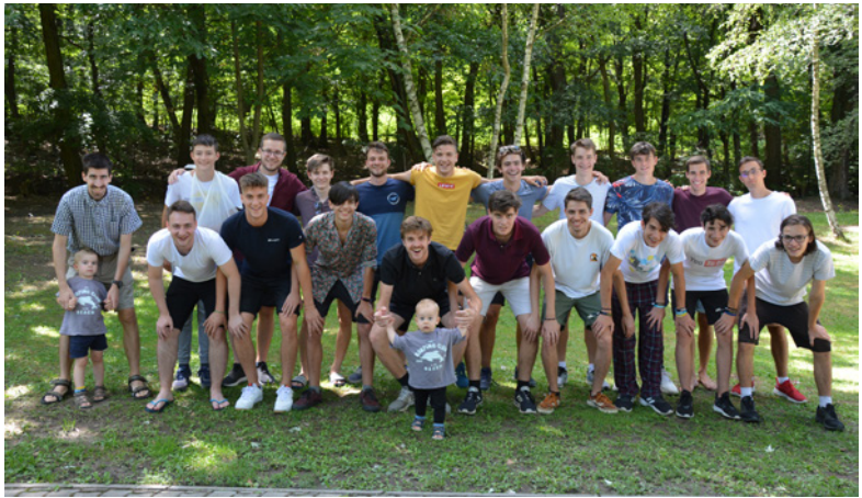
A legkisebbek is részesei voltak az „ifitábor-élménynek”