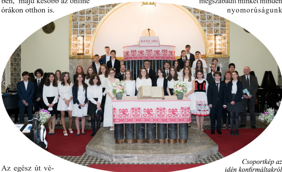
Csoportkép az idén konfirmáltakról

Hálát adok neked Urunk, hogy a konfirmációi előkészítón végig velünk voltál. Köszönöm, hogy megsegítettél, és a gyülekezet előtt vallást tehetünk a hitünkről és Rólad, a mi mennyei Atyánkról. Hálát adok, hogy velünk vagy ezekben a nehéz időkben, a járványban is, és megállhatunk előtted, elkötelezhetjük magunkat a Te követésedre. A Te szereteted és kegyelmed megszabadít minket minden nyomorúságunk