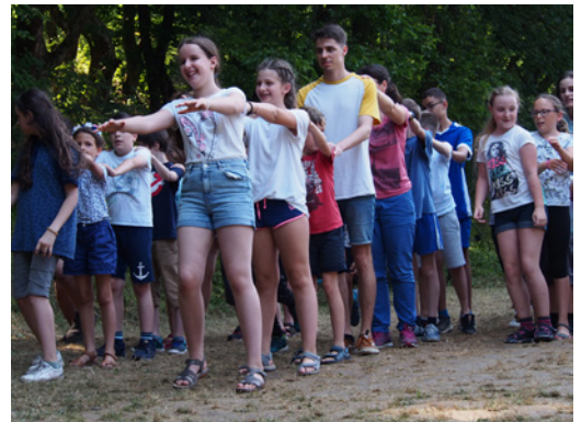
Közös játék a délutáni foglalkozáson

Nem csak az előkészületekben, hanem végig a hét során is érezhettük és láthattuk az Úr munkáját. Óvta a testi épségünket, egy lábujj-zúzódás miatt kellett mindössze kórházat látogatnunk. Megerősített, hogy ebben a hat napban itt van a helyünk. Gondolatokkal, tapasztalatokkal, élményekkel, társasággal gazdagított. Szembesített azzal, hogy harcban állunk. Biztatott, hogy küzdjünk a természetünk, rossz szokásaink, szeretetlenségünk