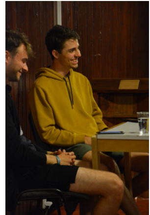
Esténként interjúkat, bizonyágtételeket hallhattunk.