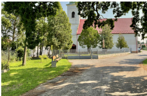
Gellér, a kis falu, ahova annyi emlék köti