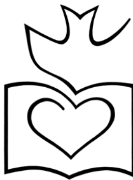
A szív tudása felülről jön. Simon András grafikája (cikkszám: 0592; a szerző engedélyével)