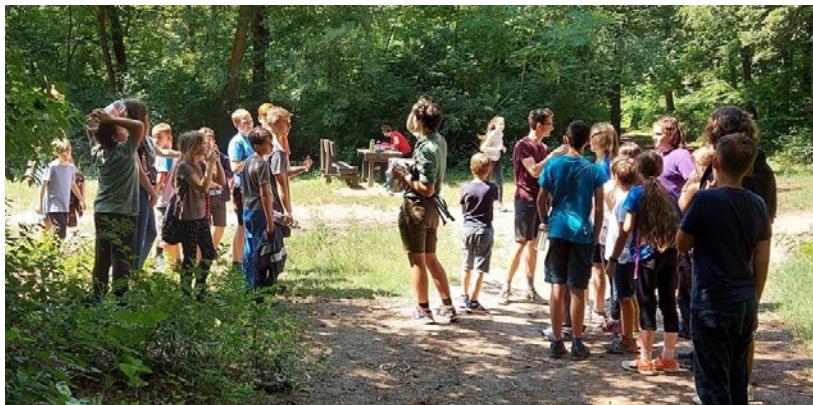
Egymásra és Isten szavára figyeltünk.