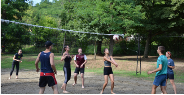
Sportban is volt részünk, a csapatok röplabdában mérhették össze tudásukat...