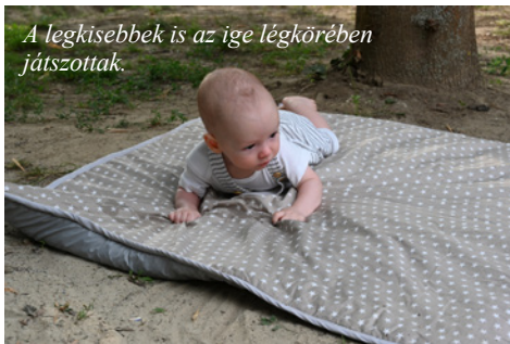
A legkisebbek is az ige légkörében játszottak.

Na persze nem csak szolgálatból állt a tinédzserek napja! A délutáni szabadidőn túl este