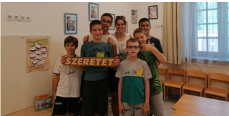
Csütörtökön a szeretetről volt szó