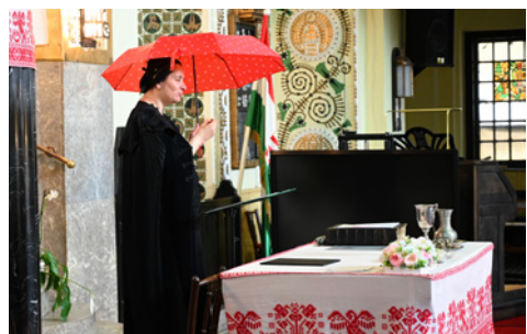
Az a bizonyos piros esernyő – a hallássérültek közötti szolgálatban fontos a szemléltetés