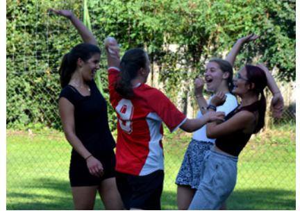
Utána pedig fociban is :)