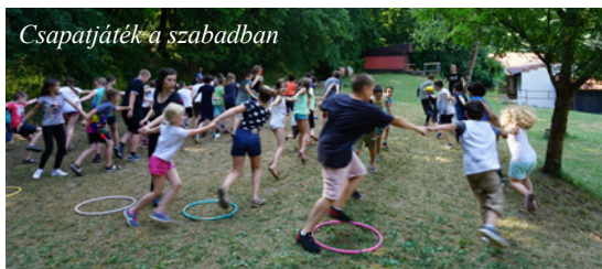
Csapatjáték a szabadban