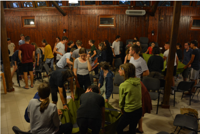
Első este csapatépítő kvízben vehettünk részt

Az összeállítást írta és szerkesztette: Nagy Réka Boglárka