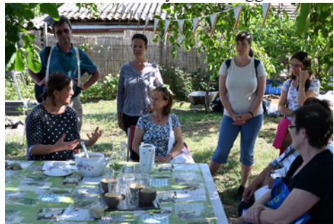
Látogatás a gyógynövény kertben

héten valami titokzatos burokból éreztük magunkat. Rengeteg különböző ember, különböző történetekkel, de mindannyiunkban volt valami közös. Isten szeretete, az irány, amerre nézünk. Tartalmas beszélgetések, délutáni röplabdameccsek, esti társasjátékok, sok-sok igei indíttatású beszélgetés. Számomra csodás élmény volt a reggeli közös