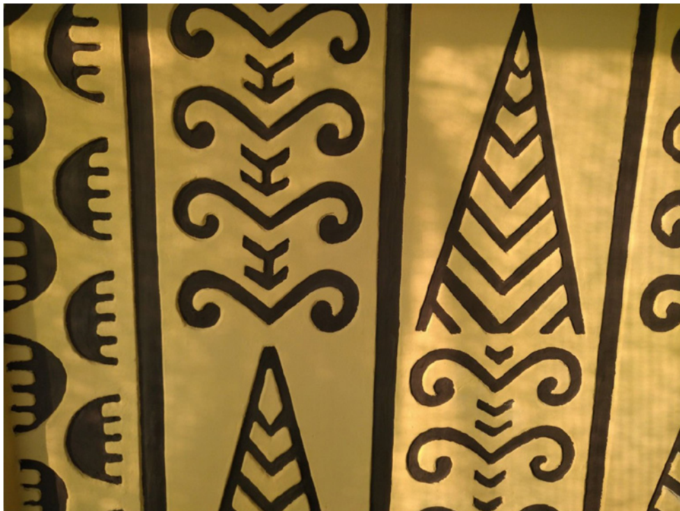
Lélegzetelállítóan szép a felújított sgraffittós elem

Sokan talán úgy érzik, hogy mindez, ami most építkezés címszó alatt a gyüleke-