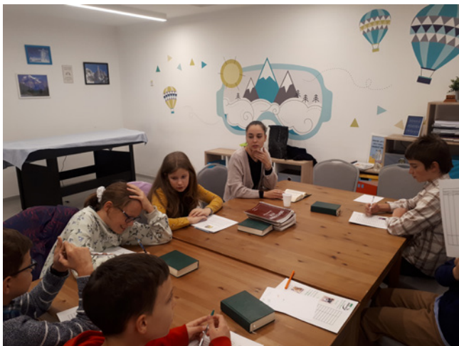
Egységes tematika alapján haladnak az iskolai és az óvodai csoportok