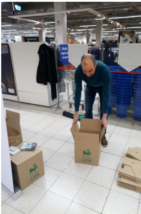
Telnek a dobozok...