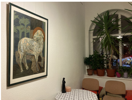
A bárányt ábrázoló festmény

A rajzok témája változatos, rögtön az első teremben Eszter könyvéhez készített illusztrációk voltak láthatók, amelyek eredetileg egy nyári hittanos táborban gyerekeknek tartott alkalomhoz készültek szemléltetésként. A kiállításon az Eszter könyvéből vett igeszakaszok is szerepeltek, amelyek a képeket inspirálták. A nagy gyülekezeti teremben főként Jézus-ábrázolásokat láthattunk (pl. keresztfeszítés-jelenetek Giotto után). A legkisebb, növényekkel berendezett teremben pedig a Barányt