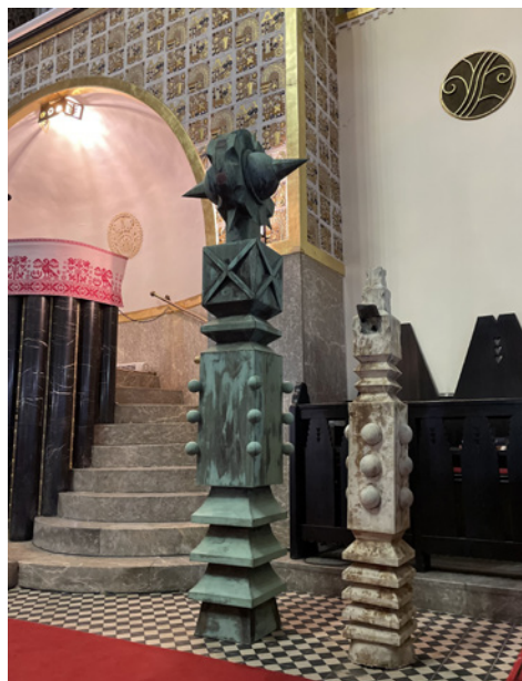
A csúcspdíz, amely felújításra vár; most közelről is megnézhetjük

...de ha másra is nyitott szemmel és szívvel nézünk körül, láthatjuk, érzékelhetjük ezt másként is: olyan munkálatok folyhatnak most, amik már régóta szükségesek, s amelyek által korszerűbbé és szebbé válik a lelki otthonunk. Olyan kivitelezésbe foghattunk