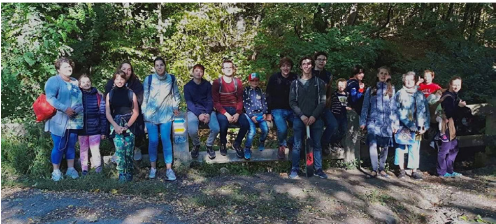
Palacsinta túra 2021 őszén

amely során a gyerekek szórakozva ismerik meg a cserkészlet mibenlétét, történelmét, hazánk életében fontos szerepet játszott személyeit (pl. feltalálói, sportolói), a hasznos csomókat (amiket a nyári táborok során építkezésre használunk), az egészségügyi alapismereteket (pl. stabil oldalfekvés, sebkötözés). Ezen kívül rengeteget játszunk, éneklünk, és időt szakítunk arra, hogy megismerjék saját magukat és társaikat. Fontosnak tartjuk, hogy megalapozzuk és megerősítsük bennük a hitet, továbbá a magyarságtudatot. Ennek érdekében közösen imádkozunk, lelki programokat szervezünk és megemlékezünk nemzeti ünnepeinkről.