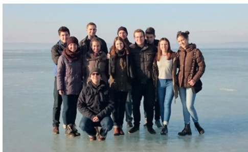
Az ifis barátokkal

– Isten gondviselését a diplomaszerezés után is megtapasztaltam. Lehetőségem adódott a továbbtanulásra, azonban a családom anya-