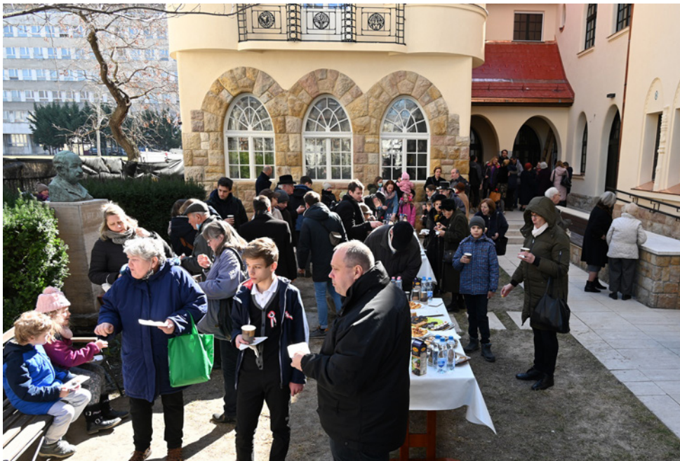
Az udvaron tartott szeretetvendégségen a gyülekezeti tagok és a vendégek (végre maszk nélkül) találkozhattak egymással.

Jézus Krisztus. Ide várunk mindenkit, hogy a valódi szabadságra, amelyre ő szabadít meg békességet, örömet, erőt, szeretetet merítve induljunk tovább a hétköznapi világába.”