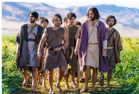
Jelenet a filmből- a mi európai kultúránk közös kincse, legnagyobb története vallásos meggyőződéstől függetlenül: Jézus élete

A legfontosabb nyilván az ismert karakterek ábrázolása, hiszen római katonából, bibliai tájból, sarukból, korabeli ruhákból már rengeteget láthattunk a korábbi, hasonló témájú filmekben. Ezen belül is a leglényegesebb Jézus alakja. A korábbi Jézus-filmekben azt éreztem, hogy a rendező világnézete szerint hol a ló egyik, hol a másik oldalán kötnek ki. Láthattunk már hippí-Jézust, negédesen kedveset, szoborszerű,