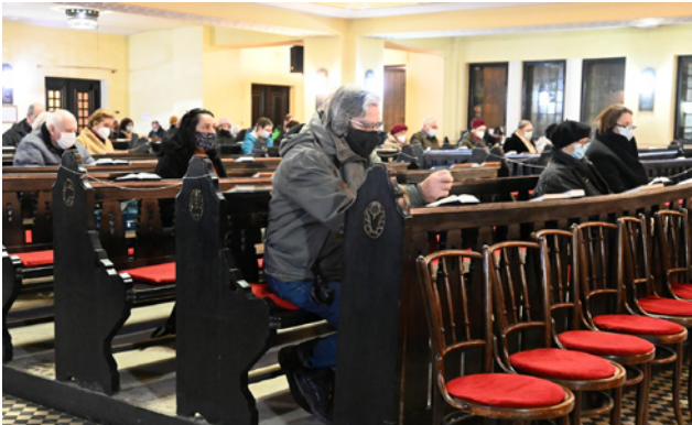
Testvérek a hitmélyítő héten

angyala, akié vagyok, és akinek szolgálok. Ez azt mondta: Ne félj Pál, neked a császár elé kell állnod, és Isten neked ajándékozta mindazokat, akik veled vannak a hajón. Ezért bizakodjatok férfiak! Én hiszek az Istennek, hogy úgy lesz, ahogyan nekem megmondta. Egy szigetre kell kivetődnnünk.” Isten a legsötétebb helyzetben is gyűjt világosságot, sőt, Ő maga a világosság Atyja. (Jn1,17) Számíthatunk az Ő világosságára akkor is, amikor fizikai világosság már nincs, amikor kétségbeejtő sötétség vesz körül. Kilátástalan helyzetben folyamodjunk az Úrhoz. Ő maga bátorít: „Hívj segítségül engem a nyomorúság idején! Én megszabadítlak, és te dicsőítesz engem.” (Zsolt 50,15.) S Pál nem feszülten, nem felindulásból a maga feje szerint olvas be a hajó vezetésének, ahogyan erre hajlamosak vagyunk. Nem azt mondja: Ugye, megmondtam. Örültség ez az egész. Mi lesz most velünk miattatok? Pál csak akkor szól, amikor bizonyosságra jut, és békesség és reménység van a szívében, hittel és szeretettel együtt. Felragyog a világosság ebben a sötét helyzetben Isten emberén keresztül. Miért és hogyan? Azért, mert megszólal az ÚR, mert kijelenti akarátát. Pál tudja, kié az élete, tudja, hogy kinek szolgál és megérti az anyagi üzenetet, amit Isten küldött tolmácsol neki. Így használja fel az ÚR az övéit ennek a bűnbe ve-