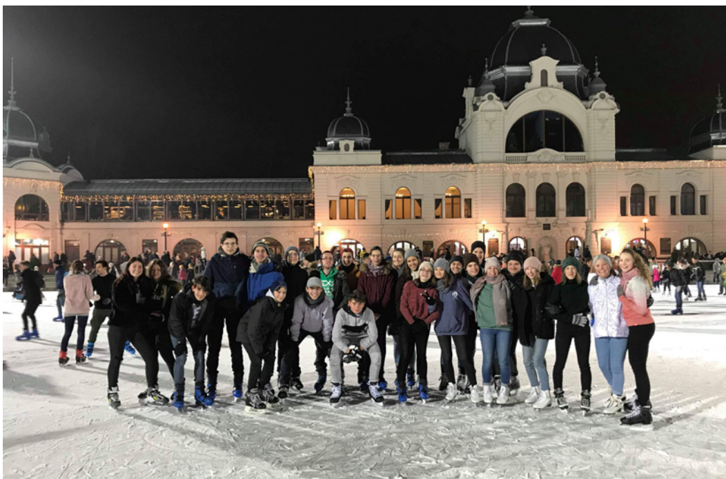
Villő az ifis korcsolyázáson