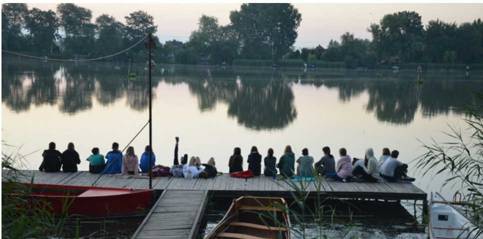
Villő és barátai a konfirmandus héten

– Habár a Baár-Madas egy keresztyén gimnázium, sajnos igen kevés hívő emberre lehet falai között bukkanni. Így osztálytársaim, közelebbi barátaim tudják, hogy nekem nagyon fontos a hitem, Isten és az összes ezzel kapcsolatos dolog és hála Neki, ezt tiszteletben is tartják és teljes mértékben elfogadják. Állandó imatémám, hogy az evangéliumot bármilyen módon képes legyek megosztani másokkal és nagy örömmel fogadom ezeket a lehetőségeket