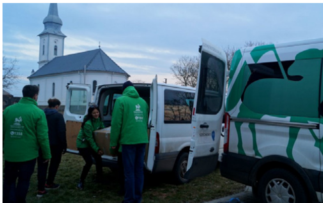
Az ukrán-magyar határhoz megérkeztek az adományok

át, s szortíroztuk. Az összefogás, a hangulat leírhatatlan volt, mindenki – akárcsak egy összeszokott zenekarban- tette a dolgát. A gyerekek számolták a csokikat, Dörmi-szeleteket, szívószálas üdítőket, ám eszükbe sem jutott kibontani, megkóstolni, a segítők sem nyúltak semmihez, még egy ásványvizet sem