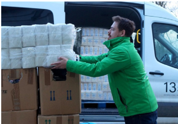
Ingajaratban vannak az autók az adomány-raktárak és a rászoruló menekültek között