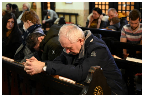
Az áhítat zárása előtt a testvérek kis csoportokban imádkoztak