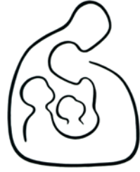
Isten alkotótársai. Simon András grafikája (cikkszám: 1691; a szerző engedélyével)