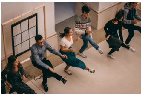
Villő a 2021-es Ifjúsági Konferencia táncszán

akár a suliban, akár bárhol máshol. A legnyegesebbnek viszont azt élem meg, hogy ahova megyek, Isten is ott van velem, hűségesen jön velem, mert már bennem (is) lakik és már csak így is mosolyokban, bátorító szavakban, ölelésekben, összenézésekben és tettekben tudom hirdetni az Ő nagyságát és szeretetét az emberek felé.