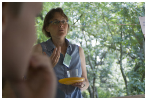
Zsó 2018-ban a sátoraljai helyi Kincskereső Táborban

Kezdetben kevesen voltunk ugyan, de egyet akartunk, és jól megértettük egymást. Igazi lelki töltekezés volt reggelenként ott állni az aulában az áhítatokon. Ezeket minden nap más pedagógus tartotta. És énekelünk is! Így vezetett az út a szívek megnyitásáig – és tovább. Úgy éreztem, Isten ölelésében voltunk ott együtt.