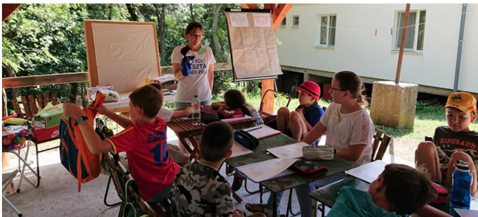
Zsó 2018-ban a sátoraljaiújhelyi Kincskereső Táborban

A tiszta szívű, tiszta tekintetű, érdeklődő gyerekek közelsége kezdettől fogva formált,