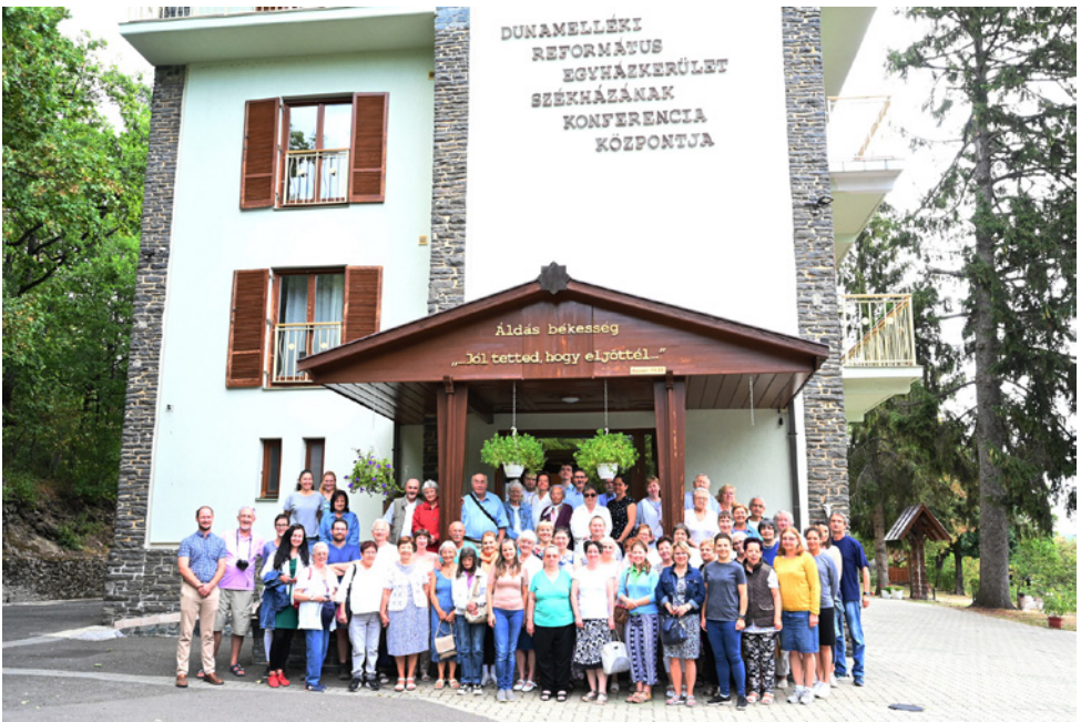
A nagy csoport a konferencia központ előtt az utolsó napon