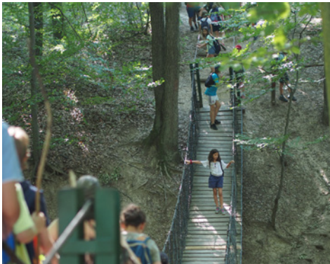
Bátorságpróba a szerdai kiránduláson

A csendes pihenőért mindannyian külön dicséretet érdemelnek a fiatalok. A második naptól kezdve sikerült nem zavarni a pihenni vágyókat, aki pedig úgy érezte, hogy most nincsen szüksége erre, azok társasjátékoztak, rajzoltak, fegyelmezetten lekötötték magukat. Csendes pihenő után két alternatív délutánt tartottunk, ezen kívül volt kirándulás, sorversenyek, vizes játékok és számháború is. Az alternatív délután idején lehetett választani: az „Alszik a város”- játék népszerű volt, ahogy az alkotás és a társasjátékok is. A nagyobbak részt vehettek élménypedagógiai foglalkozáson, aki pedig lazítani szeretett volna, csatlakozhatott a gitáros énekléshez. Általában este hat óra körül már nagyon vártuk a vacsorát, a napok mozgalmassága miatt az uzsonna leginkább arra volt jó, hogy kihúzzuk estig. Mi-