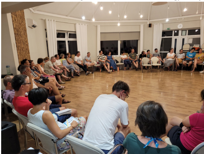
Az esti áhítatokon a házassági eskü szövegével foglalkoztunk

Számomra – különösen a covid járvány óta – felbecsülhetetlen ajándék, hogy közösségekben együtt lehetünk. A héten minden nap sok-sok jelét tapasztaltam Isten szeretetének, amely köztünk jelen volt, ajándékká vált egy kávé melletti beszélgetésben, a közös evezésben, számtalan mosolyban, kedves kérdésekben vagy egy vigasztaló ölelésben. Esténként a házassági fogadalom szövegét vettük végig az áhítatokon. Kedd este a „szeretem” kijelentés kapcsán számomra új megvilágításba került ez a szó. Egy fontos mondat maradt meg bennem az estéről: „Isten úgy akarja