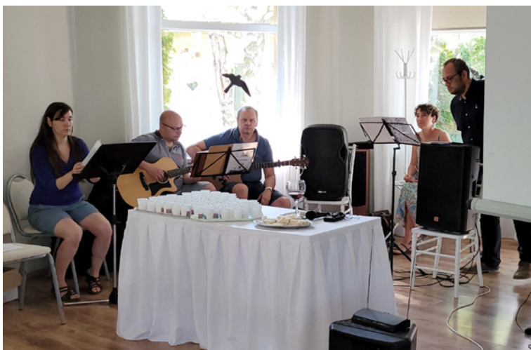
A szajoli házassággondozó hét zenekarát Isten „állította” össze