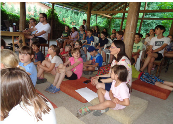
Mindenki együtt – az Igére figyelünk

amelyet a tízórai után változatos programok követtek. Egy-másfél órát szántunk a csoportos foglalkozásokra, itt mélyedtünk el az igei üzenetben, és igyekeztünk lelki kincseket gyűjteni. Péter személye és története közel hozta hozzánk Jézus tanításait: hogyan bízunk benne, hogyan kövessük őt, hogyan tegyünk vallást róla, hogyan lehetünk alázatosak és szolgálatkészek, és hogyan tudunk megbocsátani. Mind az öt csoportban kiváló munka folyt, kreatívan, a létszámnak és az életkori sajátosságok