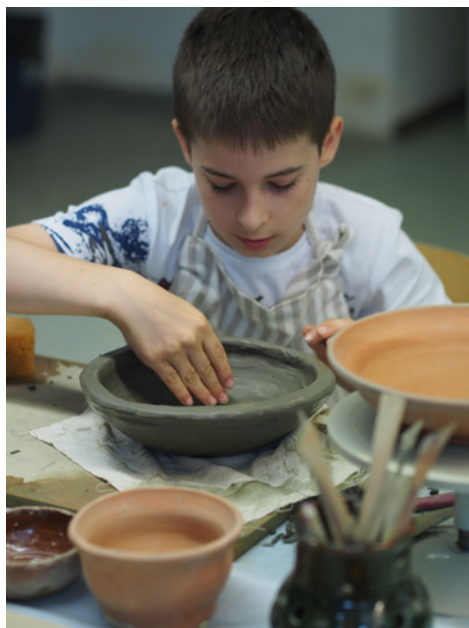
Nagy szükség van a mai életben a kézzel való alkotó munka megismerésére

Kezeink munkáját tedd maradandóvá, kezeink munkáját tedd maradandóvá!”