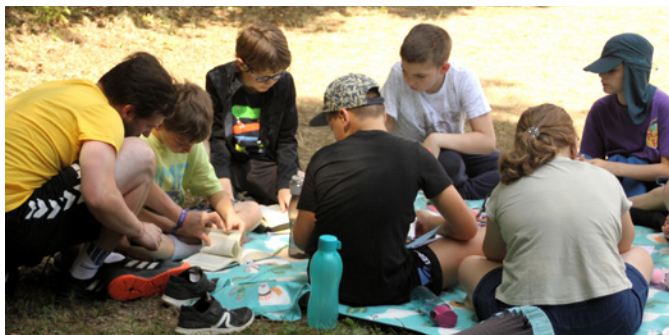
Idén is Mózi volt a Kincskereső tábor szervezője, ahol a szolgálattal mellett minden idejét a gyerekeknek szentelte

gyermekkel foglalkozni. Szerettem volna minél inkább megismertetni Jézus személyét, Isten gondviselését a tanulókkal, és bátorítani, vezetni őket az imádságban. Felszabadító volt, hogy itt konkrétan az evangelizáció és a hitre nevelés volt a feladatomban. A közeg, és a hitoktatás lehetőségei azonban nem adták meg a szükséges motivációt. Másképpen mondva, nem éreztem hivatásomnak, hogy hittant tanítsak, így két tanév után abbahagytam. Délelőttöként szoktam alkalmi, vagy akár hosszabb távú munkákat is vállalni az edzői hivatás mellett, ezek során pedig általában a kollégákkal való beszélgetések erősítettek meg abban, hogy Isten itt szeretne látni, és Ő hozott az építkezésre, a raktárba vagy akár a tejbárba. Egy történetet hadd meséljek itt el: jelenleg áruszállítóként dolgozom. Másfél éve láttam egy számomra teljesen ideálisnak tűnő hirdetést, amelyre jelentkeztem. Ön-életrajzot írtam, fényképet kerestem, néhány kérdésre válaszoltam, és aznap este (2021.02.22) e-mailben jelentkeztem. Az egyik feltétel: 5 éve érvényben lévő jogosítvány volt. Mikor