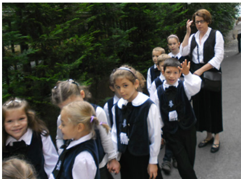
Éva elsősökkel tanévnyitóra készülve 2014-ben

mögöttem. Célként először a hagyományteremtést és a tehetséggondozást jelöltem meg. Motiválni, ösztönözni kívántam azokat, akik még nem éreztek bátorságot az írásra (később a tollforgató pályázat is rásegítette a gyereket az alkotásra). Mindvégig arra törekedtem, hogy iskolánk sajátos arculatát tükrözze az újság, és ebbe a tükörbe belenézhessenek sokan. A Juliskolában megjelenő alkotásokból szép gondolatokból kiviláglik, átragyog az iskola iránti szeretet, a barátságok igazi értéke, a tanárok tanító-nevelő munkájának tisztelete, az istenközeleti élet formáló ereje.