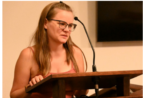
Kiss Katalin testvérünk megrázó bizonyágtétele

mit jelent Isten szeretete, közelsége, hogyan alakít körülményeket, hogyan küld embereket a szenvedő segítségére. De volt