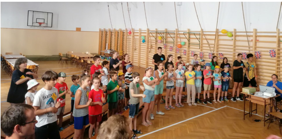
A tábori héten 35 gyermek vett részt a napi tanításon, drámajátékon, kézműves foglalkozásokon, csapatépítő kvíz-játékokon