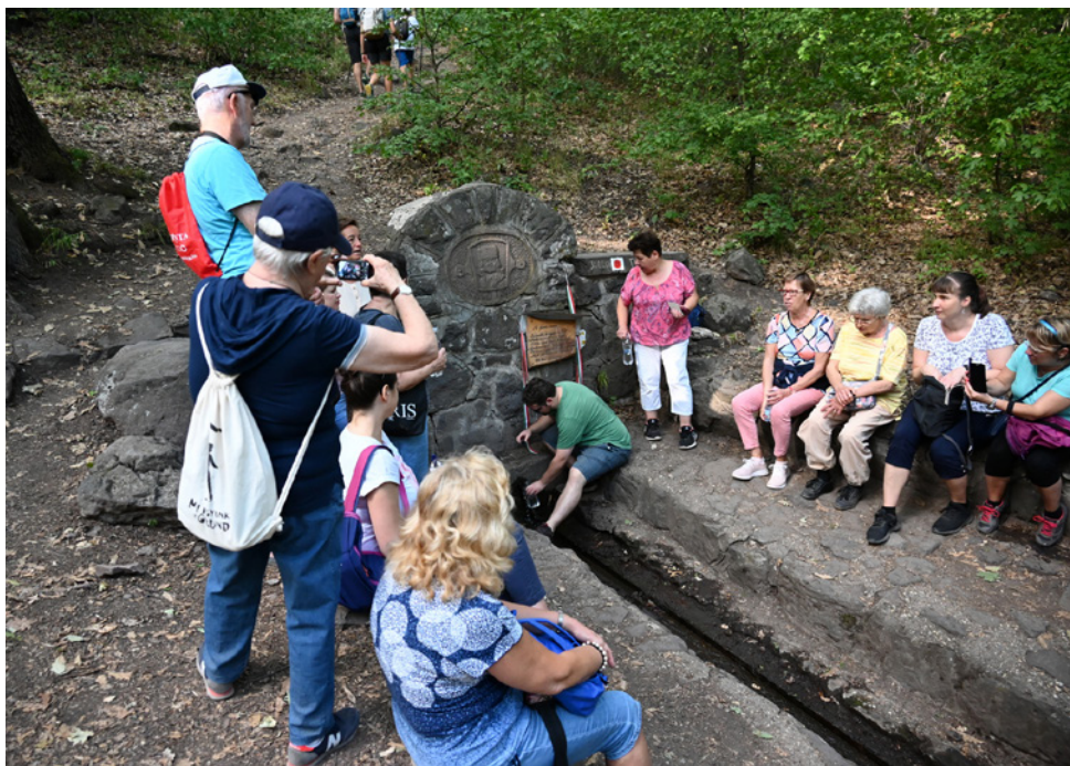
Pihenő a Rákóczi-forrásnál