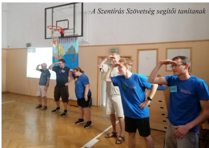
A Szentírás Szövetség segítői tanítanak

A tábor mindennapjait a Szentírás Szövetség magyar és angol anyanyelvi segítői