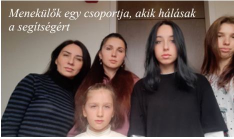
Menekülők egy csoportja, akik hálásak a segítségért

van. Felsegítettem a családot a vonatra, mert indult is percekben belül, s a hölgynek, ahogy kihajolt az ablakon, egy könnycseppje ráhullt az arcomra, Hálás volt a segítőkészségért. A Magyarországon való átutazás költségét a magyar állam finanszírozta, mint ahogyan más államok is megnyitották az utazás lehetőségét a saját területükön az ukrán menekültek előtt, csak a helyjegyet kellett megvásárolniuk. S így ment ez negyven napon át. A feleségem támogatott lelkileg, minden nap erősített, mert bizony nem kis lelkierő kellett annak elviseléséhez, hogy a megtört, síró, sokkos állapotban lévő emberek panaszát hallgassam, s próbáljam őket erősíteni. Istenre hagyatkoztam, Benne bíztam, Tőle kértem erőt, s nagyon erősen az Igére támaszkodtam, hogy megtudjam, mi az Ő akarata. Ami a csodálatos ebben a 40 napban az, hogy az egyik tolmács – aki ugyancsak a Nyugati Pályaudvaron fogadta az érkezőket - meghallotta, hogy elbocsátottak az állásomból. Én nem is nagyon törődtem azzal, hogy munkát szerezzek, mások megsegítésével voltam elfoglalva, ezen közben az ÚR gondoskodott rólam. Ez a tolmács „kolléga” ugyanis hallotta, hogy egy építési cég ukrán nyelvű tolmácsot keres, így lettem egy 20 fős, ukrán, építkezéseken dolgozó csapat vezetője, azóta is ott vagyok.