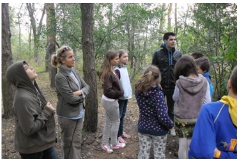
Jakabszállás-Magyarkert kirándulás 2014-ben

lelkesített engem is. Közel került Jézus szava: „ Boldogok a tiszta szívűek, mert ők az Istent meglátják ” (Máté 5,8). Már korábban vezérigémmé vált ez a tanítás – és ez az Ige vezérel napjainkban is.