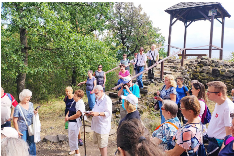
Kiránduláson – A megmászott emelkedők fizikai teherterele mellett a lélek is kapott táplálékot

oltalmamnak. Hirdetem minden tetteted.” (Zsolt 73,28.) (A zsoltár szövegét dolgozta fel hetünk éneke, amelyet a tábor résztvevői az augusztus 8-iki vasárnapi istentiszteleten az gyülekezetnek is bemutattak.)