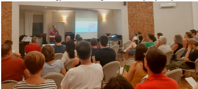
A résztvevők hallgatják az igemagyarázatot – egészen gyakorlati kincseket nyertek

Eskü. A házassági eskü szövegével foglalkoztunk az esti áhítatokon. Minden szava újra felidézte és megerősítette azt, amit megfogadtunk, és amit emberileg megtartani nem tudnánk, de mivel Istent magát tekintjük