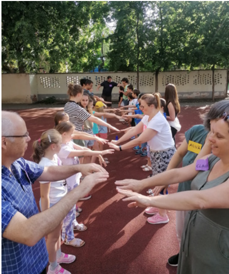
A hét témája a kapcsolat volt

biztosították, valamint a fasori gyülekezet öt lelkes szolgálója, egy konyhai dolgozó és egy „Juliannás” pedagógus áldozatos szolgálata segítette.