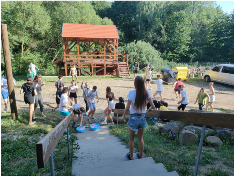
Az emlékezetes vízcisnata