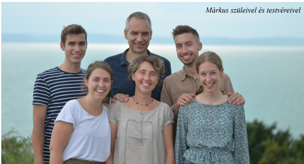
Márkus szüleivel és testvéreivel

legyen szó kihívásokról, mélységekről vagy örömeikről.