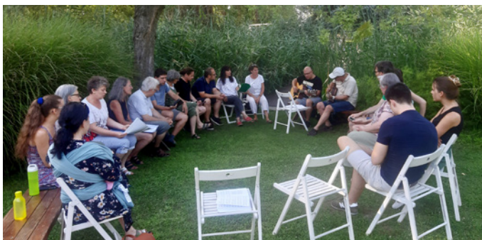
Közös éneklés a „szigeten”

szeretni a társadat, hogy téged tett mellé, hogy ezt a szeretetet közvetítsd.” Megértettem, hogy ez nemcsak ajándék, de felelősség is: Isten rajtam keresztül akarja a férjemet szeretni, az Ő gyengéd szeretetét, elfogadását, megbocsátását kell közvetítenem felé. Imádkozom, hogy ezen az úton Isten formáljon engem, alakítson át, hogy alkalmas legyek erre az egész életen át tartó küldetésre.