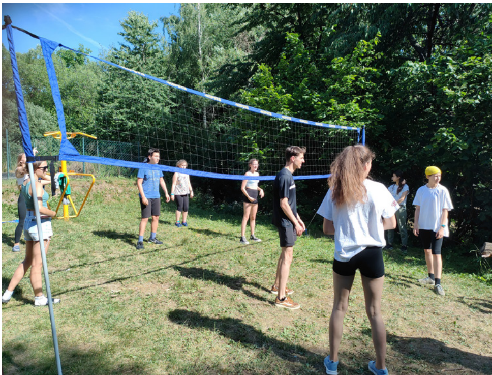
Az élvezetes röplabda

„Az esti túrán éreztem a legjobban magam.” (Ahova először alig akart menni a csapat, aztán pedig kétszer olyan hosszú lett, mert nem akarták befejezni.) „Az volt a legjobb, hogy Istennel, és egy számomra hihet-