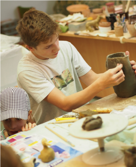
Az agyaggal való munkálkodás koncentrált figyelmet igényel