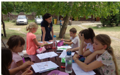
Igazi kihívás volt a délelőtti játék

Imádságra, közös éneklésre és játékokra gyűltünk össze,