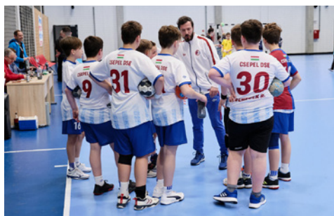
Mózi kézilabda edzőként dolgozik a Csepel Diáksport Egyesületnél, ahol 12 és 13 éves fiúkkal foglalkozik