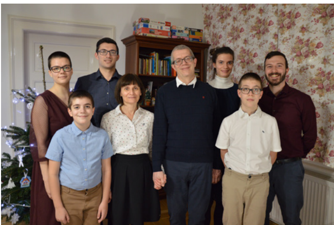
Mózi szüleinevel és testvéreivel

– Valahol érdekes, hogy a hitoktatással szemben a gyülekezeti gyermekek közötti szolgálatot hivatásomnak érzem. Mind a gyermek istentiszteleteken, mind a Kincskereső táborokban aktív vagyok az utóbbi években. Három alkalommal vezethettem már a Kincskeresőt, ami hatalmas tapasztalat az Úrról minden alkalommal. Azt hiszem, olyan készségeket, adottságokat kaptam, amelyek lehetővé teszik, hogy ilyen felelősséget vállaljak. Koromhoz képest eléggé tapasztalt vagyok a területen, és folyamatosan igyekszem tanulni, fejlődni. Nyilván ezekkel együtt is sok olyan dolog van, amit a táborozás során Isten “pótol ki”, gyakran a szolgáló csapatomon keresztül. Mind az előkészítés, mind az utólagos értékelés során kisebb-nagyobb visszajelzéseket kaptam az elmúlt három évben, hogy kedves az Úrnak ez a szolgálat. Élvezem azt a közeget, amit a gyermekek számára ki tudunk alakítani. Megnyílnak, biztonságban érzik magukat, és biztos vagyok benne, hogy nemcsak nekünk és velünk, hanem az Ige közelében is. Igyekszünk fejleszteni a szociális kompetenciáikat, és egyéb készségeiket is,