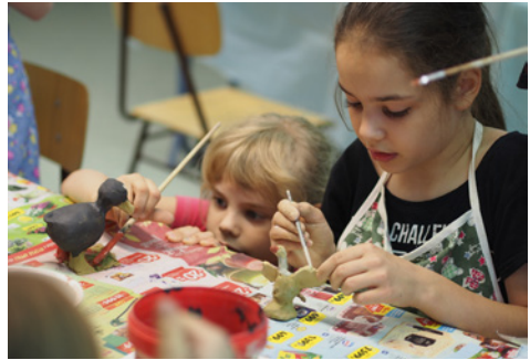
Kicsik és nagyok együtt buzgólkodtak

Jó volt minden reggeli ígét megbeszélni a táborozó gyerekekkel, jó volt igével és imával kezdeni a napot. Jó volt a tevékenységünket Isten jó akaratába ajánlani. Ha rá figyelve dolgozunk, a munkánkon áldás lehet, és az eredménye valami maradandót mondhat, jelenthet annak, aki a kezébe veszi.