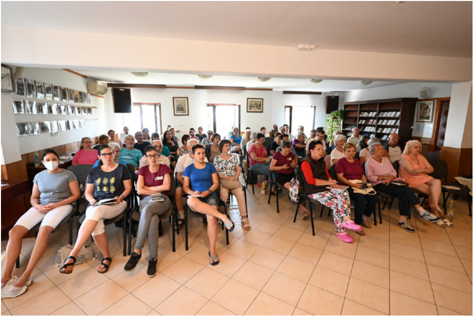
Előadáson a nagyteremben