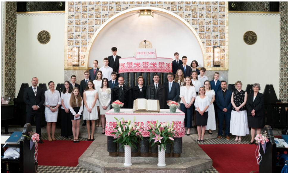
Csoportkép a május 29-én konfirmáltakról – 19 fiatal és 7 felnőtt tett ünnepélyes fogadalmat Jézus Krisztus iránti hűségéről