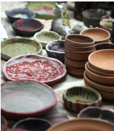
A kézzel-szeretettel készült tárgy más, mint a gyári sorozat termék

Az alkotás iránti igény, az ehhez kapott képesség, erő Isten ajándéka, amely különös örömet adhat annak is, aki készíti és annak is, aki az elkészült tárgyat a kezébe fogja. A kézzel-szeretettel készült tárgy más mint a gyári sorozat termék. Benne van az alkotó keze nyoma, „lelke” van. Ahogy Isten „keze” nyomát mi is magunkon viseljük abban, hogy minden mástól különbözünk. Teremtés és alkotás közötti különbség; Isten és az ember munkája közötti különbség. Ő a szavával teremteni tud, mi a tőle kapott erővel és tehetséggel alkotunk reménység szerint az Ő dicsőségére. Nagy szükség van a mai életben a kézzel való alkotó munka megismerésére. Vannak emberek, akiknek nem a szó, a beszéd a legfőbb kifejező eszközük. Az agyaggal való munkálkodásban a térérzékelés egészen más dimenzióját érezhetik meg. Egész egyéniségükkel, sokféle érzékszervükkel és kezük munkájával kell részt venniük ebben a tevékenységben, mely sokszor erő kifejtést, koncentrált figyelmet, kitartást igényel, de egyben örömet okoz.