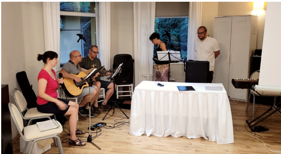
A „zenei kenyérszaporítás” több szinten is bekövetkezett