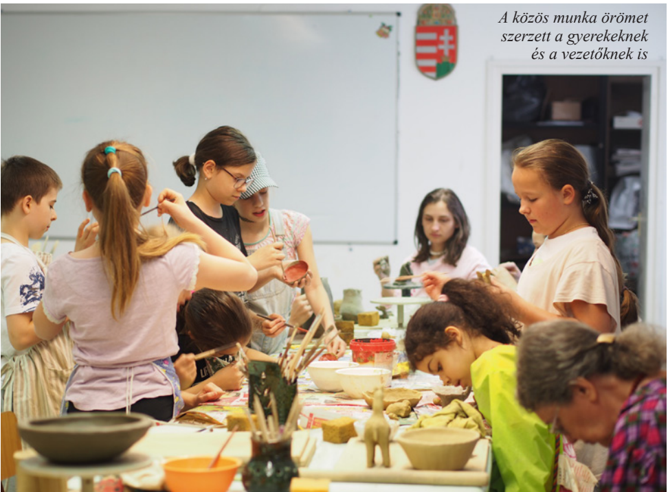
A közös munka örömet szerzett a gyerekeknek és a vezetőknek is