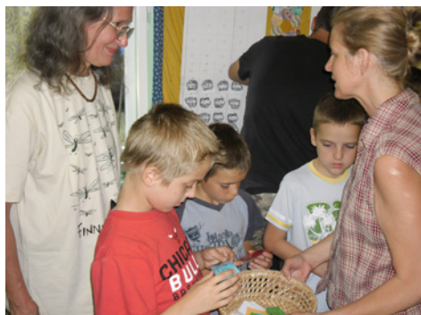
Kincskereső tábor – esti lelki program 2013-ban