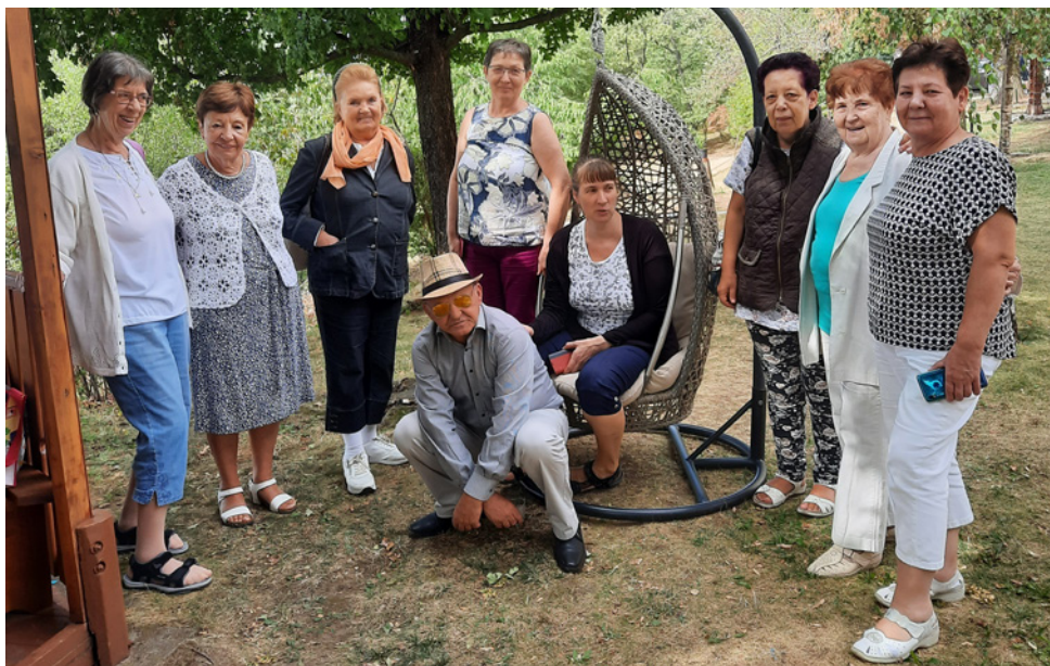
Szünetben is csoportosan?