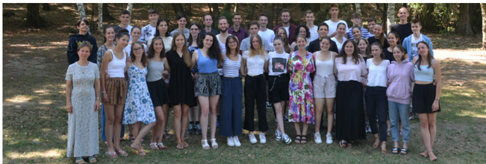
Csoportkép a résztvevőkről – „Örültünk, hogy együtt tudtuk hallgatni az igét, Istent dicsőíteni, sportolni, túrázni”

„Hála van a szívemben az idei ifihétért! Szolgáloi oldalon először vettem részt ebben a táborban. Akik ott voltunk, együtt növekedhettünk abban a témában, hogy Isten miben és hogyan vezet bennünket. A csoportbeszélgetésekben azt tapasztaltam, hogy valamilyen módon mindenki tud kapcsolódni ehhez a témához, hiszen Isten gyermekeként életünk egészét áthatja az isteni vezetés. Jelen van a baráti, iskolai és családi kapcsolatainkban, az aktuálisan adott élethelyzetünkben (akármilyenek is a körülmények), még a nehézségeinkben is – mert mindannyian voltunk vagy vagyunk éppen most olyan krízisben, amiben nem látjuk a megoldást, de kapaszkodhatunk abba az ígérethez, hogy Isten ilyenkor is tényleg velünk van. Olyan jó volt a hét végén azt megélni, hogy „kerek egész” volt a hét, ahogy kibontakozott. Az egyéni és csoportos beszélgetésekben felmerülő témákra sokszor egy következő alkalom adott megerősítést, ami egyértelműen mutatja, hogy Isten munkálkodott közöttünk. Hatalmas ajándék volt számomra, hogy egyrészt nagyon közeli barátaimmal szolgálhattam együtt, másrészt a sokszínű programokon és élményeken keresztül sokakat jobban megismerhettem az ifiből.”