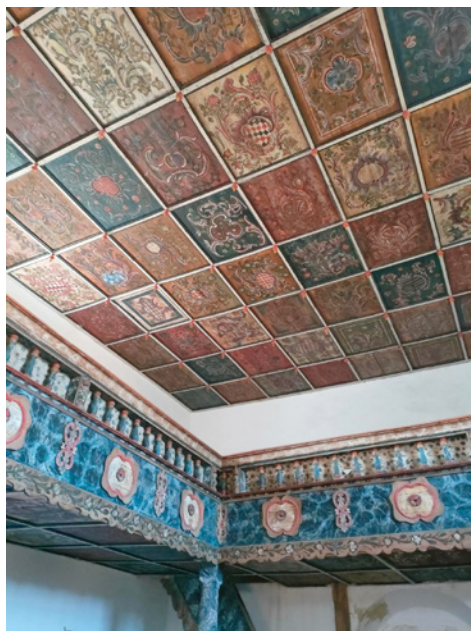
A drávaiványi református templom

Híres a Sellyei Református Egyházközséghez tartozó Drávaiványi gyönyörű fakazettás temploma. Három református él ott, közvetlenül a határ mentén. Mégis csodálatos látni, ahogy gondoskodnak a templomról! Ápolják, karbantartják, kitaranak, és örömmel mutatják az arra járóknak.