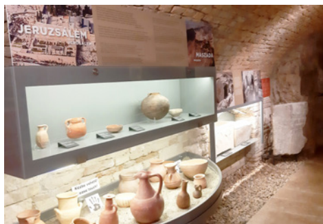
A Biblia világát különböző régészeti tárgyakon keresztül mutatják be

A Ráday Ház felújításának időszakában a Bibliamúzeum nem költözött ki az épületből, a kényszerbezárás idején kisfilmeket készítet-