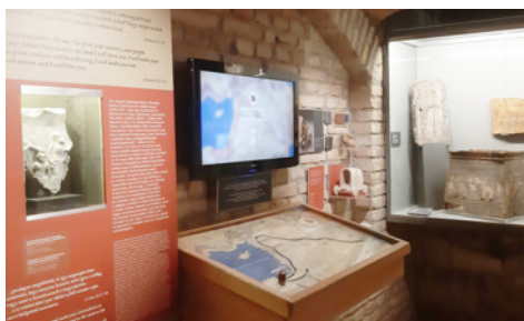
Ábrahám útja – Az első interaktív elem: Ábrahám vándorlása

„A kiállítás nagyterme kronologikus sorrendbe veszi a Biblia világát, az első interaktív elem Ábrahám vándorlása. Van egy kis makettünk, egy kis kocszi, amivel a térkép segítségével követhető az út, ahol Ábrahám vándorol. Itt azokat az igeverseket emeltük ki, amelyek az ő vándorlásához kapcsolódóan a helyszínhez kötődnek. Fontosnak találtuk, hogy földrajzilag elhelyezzük azt, amit a Bibliában olvasunk, másrészt pedig egy képi világgal vizuálisan is bemutassuk. Megjelenik az igevers és régészeti kép az adott helyről, valamint egy mai fotó” – magyarázza a Bibliamúzeum munkatársa.