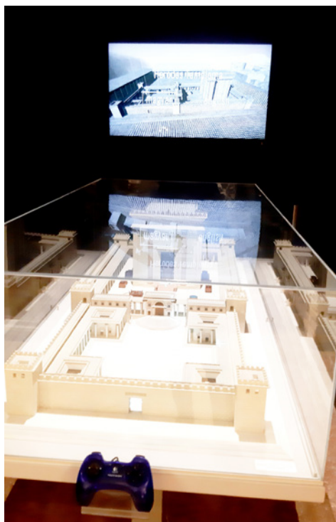
A Heródes templom makettje