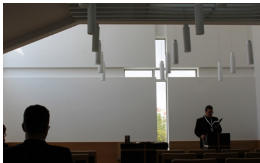
A kápolna keresztje a mi jelképünk Krisztus követésében