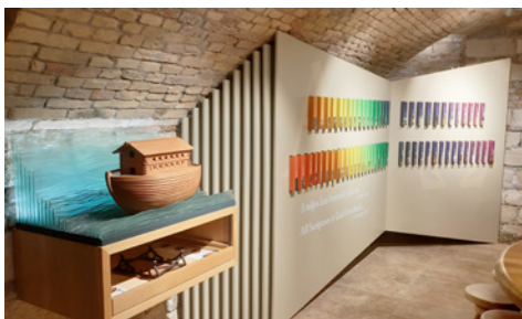
Noé bárkája – A látogatók felépíthetik Noé bárkáját

A tárlat a teremtéstörténettel kezdődik, majd az Újszövetségen keresztül vezet el az első keresztény közösségek megalakulásáig. Az egyes állomások jól érzékeltetik azt a kortörténeti háttérrel, amelyben a Biblia szereplői éltek. A múzeumot úgy alakították ki, hogy minden korosztály otthon érezze magát benne, a Biblia történeti kicsiket és nagyokat is megszólítanak.