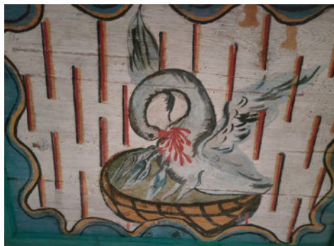
Fiait vérével tápláló pelikán – A Patapoklosi Református Templom egyik kazettája