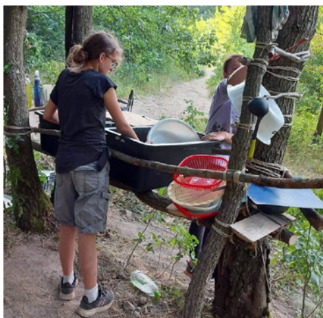
Étkezés utáni mosogatás, ami minden nap más őrnek volt a feladata