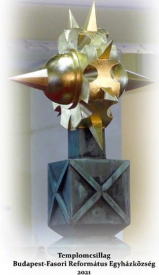
Templomszillag Budapest-Fasori Református Egyházközség 2021