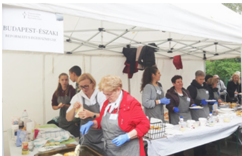
A Fasori gyülekezet is segített a szeretetvendégségben

téren, ahol a dunamelléki egyházmegyei sátraikban vendégül látták a hozzájuk betérőket. Bográcsban főtt a szürkemarha- és mangalicapörkölt, tradicionális fazekakban készült a babgulyás, a töltött káposzta, és sok finom süteményt is kínáltak.