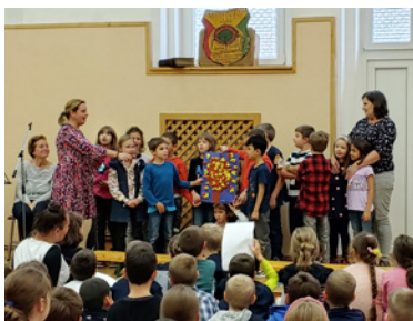
A 2. osztály csipkebokor bemutatója