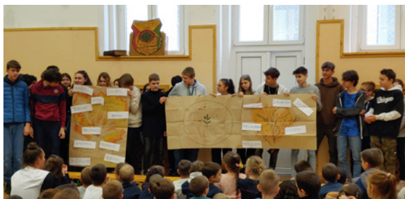
A 8. osztályosok bemutatója