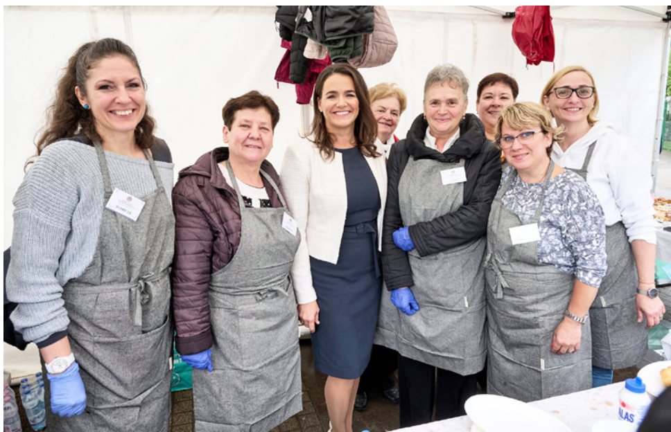
Novák Katalin köztársasági elnök is meglátogatta a fásori szolgálócsapat sátrát