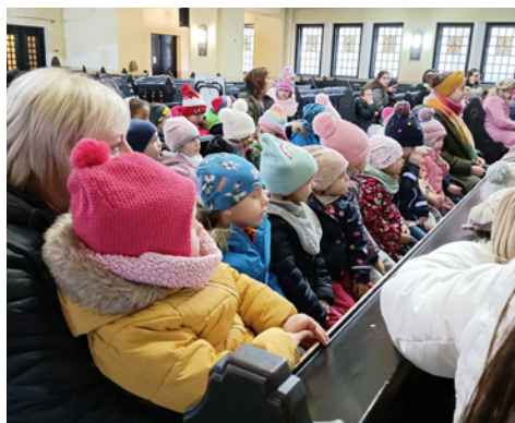
A templomban a legkisebbekkel

Hála a Reformáció és Biblia állomásokért, az iskola újraindításának 30 éves állomásaiért. Végül pedig a gyönyörű csipkebokor-bemutatókban gyönyörködhettünk osztályonként. Itt megtapasztalhattuk, hogy milyen gazdag és sokféle ajándéka van minden pedagógusnak és osztálynak. Külön ajándék, hogy az ukrán, és orosz diákok egy csapatként ajándékozták meg a közösséget. Hála, hogy zengi az egész iskola: Solus Christus, sola gratia, sola scriptura, sola fide, soli Deo gloria! Egyedül Krisztus, egyedül a Szentírás, egyedül kegyelemből, egyedül hit által, egyedül Istené a dicsőség!