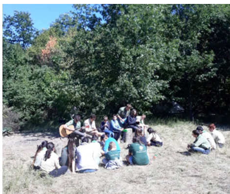
Vasárnapi dicsőítés gitáros kísérettel