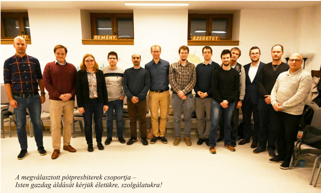
A megválasztott pópresbiterek csoportja – Isten gazdag áldását kérjük életükre, szolgálatukra!