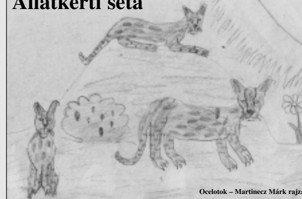
Ocelotok – Martinecz Márk rajza