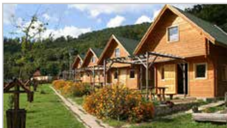
A teremtett világ csodálatos ölelésében tölthetünk egy hetet

A jelentkezések alapján jelenleg a fürdőszobás szobák beteltek. Azonban a fürdőszoba nélküli faházak is szépek, felújítottak, 4-6 ágyasak. Árnyas helyen vannak, amit a nagy fák biztosítanak. A közös mosdó is felújított, közel van a faházak-