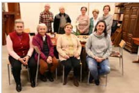
Csoportkép a Diakónia szolgálati ág szolgálóiról

Egyre több gyülekezeti testvérrel tudunk megismerkedni, akikkel találkozáskor örömmel üdvözljük egymást és beszélgetünk. Ezt a kapcsolatot sokkal jobbnak tartom, mint bármilyen más emberi közösségen belüli kapcsolatot, aminek okát abban