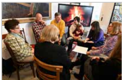
Családos napot tartottunk gyülekezetünkben decemberben - A közös beszélgetés, játék, lelki épülésünkre volt.