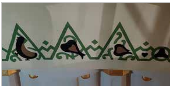
Minden egyes mintát átfestettek

– Számomra a legfontosabb élettér Isten lelki családjának az otthona, a templom. Isten háza. Ennek teljeskörű megújulása valóban kimondhatatlan örömet, és megrendülést jelent számomra. Eddig is hódolatra indított gyönyörű templomunknak a valósága, de most megrendülten hajtok fejet és térdet Isten csodálatos nagysága előtt, aki lehetővé tette, hogy ez a templomter a megépülése után talán a legszebben tündököljön. Ennél már csak az a még csodálatosabb a számomra, Isten hatalmas arra is, hogy megújuljunk mi magunk is,