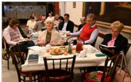
Szolgálatvezetők Karácsonya decemberben

Igazán gazdag volt ez a néhány hónap, sok mindenért hálát adhattunk, imádkozhattunk egyházunkért, előljáróinkért, gyülekezetünkért és egymásért is. Mindig lelki ajándék, amikor együtt lehetünk, együtt visszük Isten elé örömeinket, nehézségeinket, feladatainkat, megajándékozottságunkat. Tudjuk, hogy Isten a gyülekezetbe hívott el bennünket, itt tud igazán építeni bennünket egyen-egyenként és közösségként is, itt tud tanítani, vigasztalni, bátorítani, vezetni a „keskeny úton.” Jöjjünk bátran a hétközi alkalmakra – nyári