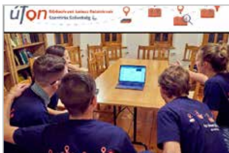
Az ut-on.hu számos újdonsággal szolgál a diákoknak

Tavaly, amikor idekerültem, azt láttam, hogy nem csak a Szentírás Szövetség foglalkozik tábor szervezéssel, és ilyen kiadványokkal. Egy konferenciára meghívtuk a többi általunk ismert táboroztatással (is) foglalkozó szervezeteket, hogy ők is mutassák be a kiadványaikat, és ezen keresztül tapasztalataikat és gyakorlatukat. Elmondhassák milyen segítséget tudnak adni a gyülekezeteknek ebben a misszió-