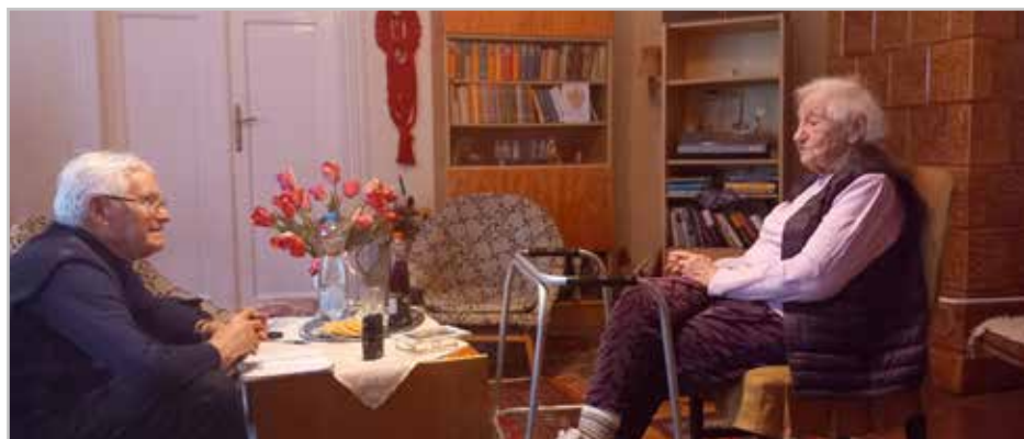
Jolika az életéről mesél

Az ostrom idején nemigen mozdultunk ki, otthon imádkoztunk, énekeltünk. Apukám sok gyönyörű zsoltárt megtanított minékünk. Ezekben vigasztalást, megnyugvást, reménységet találtunk. Sokszor az óvóhelyen húztuk meg magunkat, de a csalódás, a rettegés oda is utat tört magának. Az orosz katonák – káromkodások közepette – onnan is elhurcoltak fiatalasszonyokat, lányokat – egyszer velem együtt. Megpróbáltam menekülni. Fölfutottam a földszintre. Utánam lőtt, de nem talált el (ott maradt a lyuk az ajtóban). Aztán lejött az óvóhelyre, ahonnan elvitt bennünket, de én nem arra mentem vissza. A lent lévők örültek annak, hogy megúsztam, de sajnálkoztak is rajtam – látva, hogy szinte nem bírok lábra állni. Családtagjaim viszont azt is igazolva látták, hogy az Úr csodásan működik . Együtt énekeltük ezt a szép éneket – hálaadással.