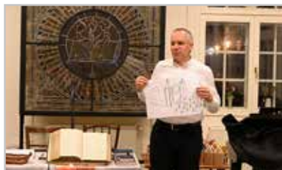
Mindenki lerajzolta, hogyan képzei el a 2024-es évet

A szolgálátvezetők a lelki megújulásra, Krisztushoz közelebb kerülésre, a gyülekezeti tagok megszólítására helyezték a hangsúlyt.