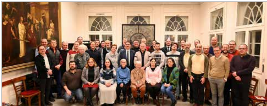
A leköszönő és új presbitérium egy része - Közös szeretetvendégségen vettek részt január 9-én

A régi és az új presbitérium hálaadó alkalmon lehetett együtt, ahol a presbiteri szolgálatból elköszönők és a szolgálatba újonnan érkezők együtt adtak hálát mindazért, amit Isten a Faszorban végez.