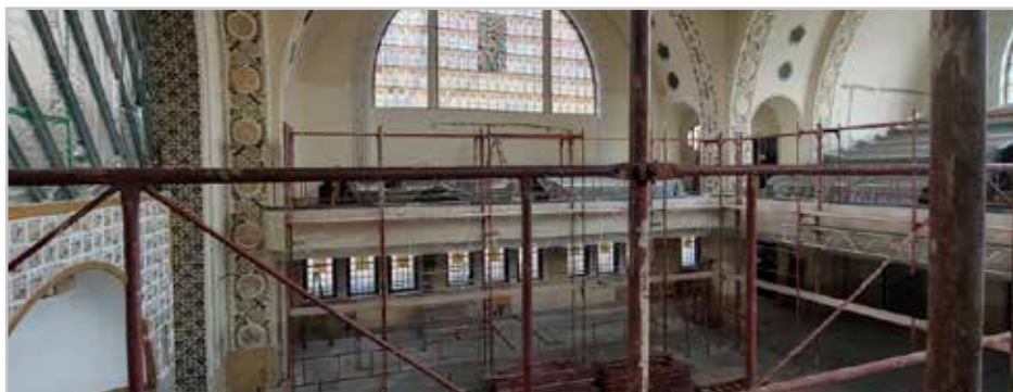
Felállványozva a templombelső - Reményeink szerint hamarosan megszépülve, megújulva vehetjük birtokba.

– A megrendelői oldalon mindenáron arra törekszünk, hogy ez a tervünk Isten kegyelméből megvalósulhasson. A kivitelezővel való egyeztetések, az általános heti többszöri egyeztetéseken túl, fokozatosan még intenzívebbé, sűrűbbé válnak. Jó tapasztalni, hogy a mi célunk és a kivitelező célja alapvetően ugyanaz, közös. A kivitelezés ütem szerint halad. Komoly munkaerő mozgósítása történik. Természetesen az időközben előkerülő nem várt kérdéseket pontosan, tervvel alátámasztva