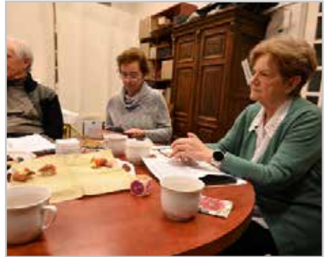
Készül a Diakónia szolgálati ág 2024-es munkaterve

got, hanem mi is, tapasztalva az ő ujjongó örömét. Sajnos, a daganat kiújult, újabb kezelésekre és segítségre volt szüksége. (Így került el tőle a gondozottja.) Amikor tehetünk, látogattuk. Nemcsak a gyógyszer, tápszert igyekeztünk neki beszerezni, hanem minden alkalommal