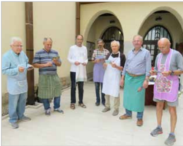
A férfiak szolgálata a tavaly szeptemberi női csendesnapon