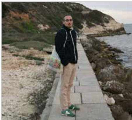
Boti a tengerparton - „Mindig tudtam, hogy Isten létezik”

Mielőtt betöltöttem volna a 18-at, nyáron volt egy nehezebb időszakom, távol éreztem magam Istentől, kerestem a helyem a világban. Egyik nap nagyon mélyen éreztem magam, valamiért nagyon féltem, pedig nem volt rá különösebb okom. Ekkor