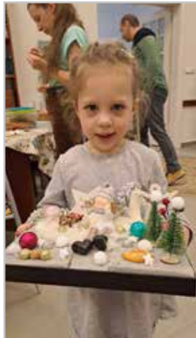
Az alkotók boldog mosollyal mutatják műveiket