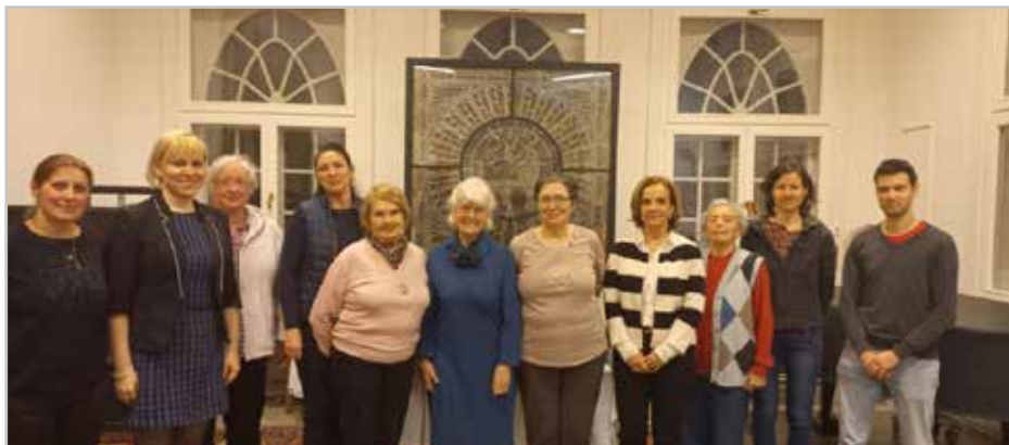
Csoportkép a résztvevőkről - Krisztus nyomában

Megtanulhattuk, hogy mindkét fiúnak szüksége van a kegyelemre, mert nemcsak a szabályszegés, de a szabály megtartása mellett is elveszett lehetsz, a vallásos moralizálás az eredménycentrikus erkölcsösség, a jótett felett érzett büszkeség, az önigazultság, a pokolian jó cselekedet mögött is ott álalodhat a bűnös magatartás. De ha Krisztus van a középpontban, ő helyretesz mindent.