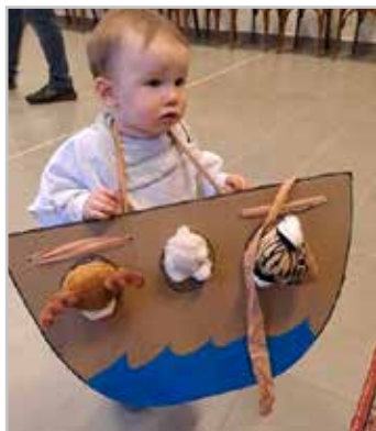
A legnagyobb tetszést a legkisebb résztvevő aratta Noé bárkája jelmezével