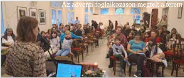
Az adventi foglalkozáson megtelt a terem

Reméljük, hogy minden út, amire magukkal viszik az ajándékot, eszükbe juttatja, hogy nincsenek egyedül, az Úr velük van. Sőt, egy másik úton is járhatnak, a keskeny úton, ami az örök életre visz. Isten áldását kérjük gyülekezetünk, intézményeink és minden hittanosunk és családtagjaik életére!