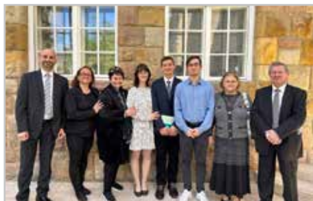
Boti és családja