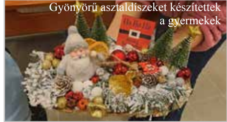
Gyönyörű asztaldíszeket készítették a gyermekek

Hálásan köszönjük minden gyermek nevében a karácsonyi ajándékosomagokat. Idén tornazsákot kaptak a gyermekek. Rajta ezzel az igével: „ Utáidat, Uram, ismertesd meg velem, ösvényeidre taníts meg engem! ” (Zsoltárok 25:2).