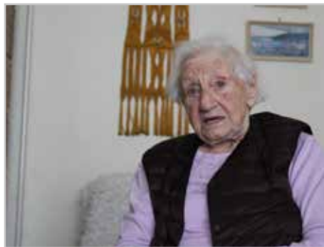
„Megragadott engem is a Krisztus”

Magam is átélem, hogy amikor az ember Isten közelében él, és Bibliáját rendszeresen olvassa, naponként születnek benne hasonló gondolatok, és árad belőle a hála. Testi-lelki jóllétünkért, boldogulásunkért meg kellett vívni a magunk harcát a gyakorlati változó társadalmi körülmények közepette. De a segítség bizony felülről jött. Testvérem orvos volt, s ugyanúgy az ő két fia is. Egyik lányom és férje szintén orvosok. Isten ily módon, általuk gondoskodott felőlünk – test szerint. Lélek szerint pedig adta az Ő nagy családját, a gyülekezetet.