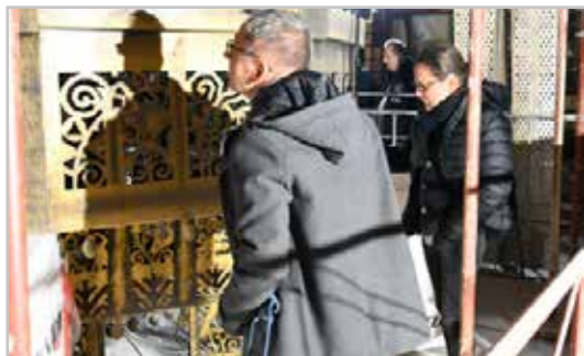
A presbitérium tagjai megszemlélik a leeresztett csillárt.

– Volumenében olyan értékű és szépségű templom és épületegyüttes bízott a gyülekezetünkre, amely műemlék jellegénél fogva minden korban, minden alkalommal karbantartása, megújítása tekintetében rendkívül komoly segítséget igényel. Há-