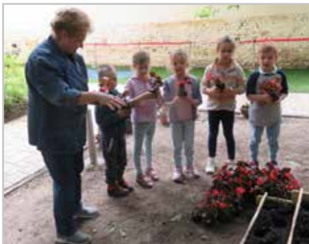
Virágokat palántáztunk az óvoda udvarában a virágládákba.

A diakóniai munkámban – mint arról már oly sokszor írtam és beszéltem – a gyermekek bevonása a szolgálatba nagyon fontos számomra. Ezért is szerveztünk a Csipkebokor Óvoda kis lakóival közös programokat a szolgálatban 2022-ben. Akkor első alkalommal virágokat palántáztunk az óvoda udvarában a virágládákba, tavaly pedig fűszer-, és gyógynövények magjait vetettük ágyásokba. Ennek a nevelési értéke is nagyon fontos, hiszen óvodásaink