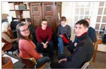
Legközelebb Virágvasárnapon lesz családos nap, melyre mindenkit szeretettel hívunk!