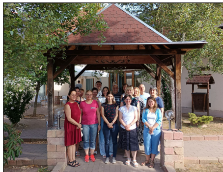
Csoportkép a tábor résztvevőiről

feletti egyedülállót a szeptemberben folytatódó alkalmainkra, csütörtök esténtként, 18 órától az ifiterembe. Bővebb információ az ecsediana@gmail.com címen kérhető.