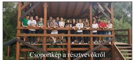
Csoportkép a résztvevőkről