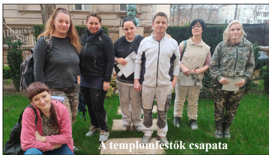
A templomfestők csapata

- Első körben pauszpapírral levettük a mintát, hazavittük, és egy hatalmas fóliára lett átrajzolva. Azután ki kellett találni, hogyan lesz felosztva a minta, hogy ki tudjuk vágni, meg föl is tudjuk helyezni. Otthon kitaláltam, hogy hol legyen megvágva, hol a legegyszerűbb összepasszítni, még hogyha torzulás is van az ívben. Utána behoztam. Ahol a vakolat is lejött, ott nem is lehetett volna másképp, csak újrafesteni.