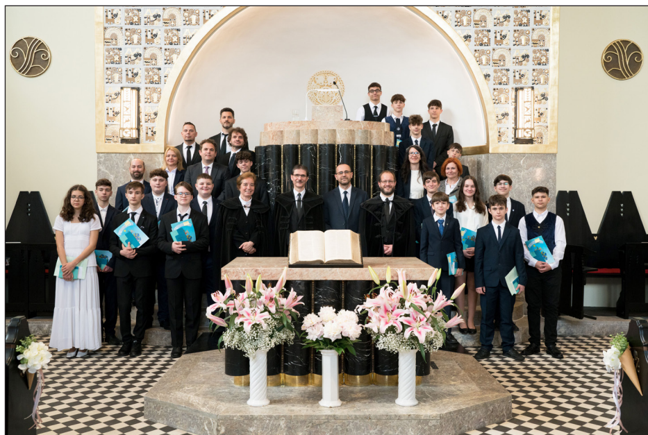
A konfirmációi fogadalmat tett fiatalok és felnőttek csoportja - Nagy örömünkre megtelt a templom az ünnepi alkalomra