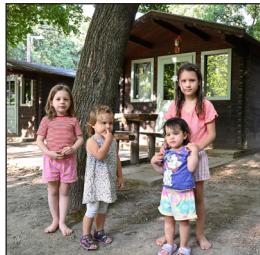
Legkisebbek a táborban