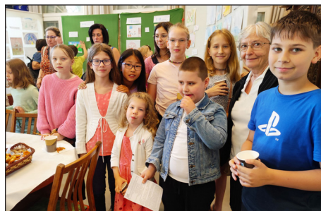
Hittanos gyermekeink a szolgálókkal a szeretetvendégségen