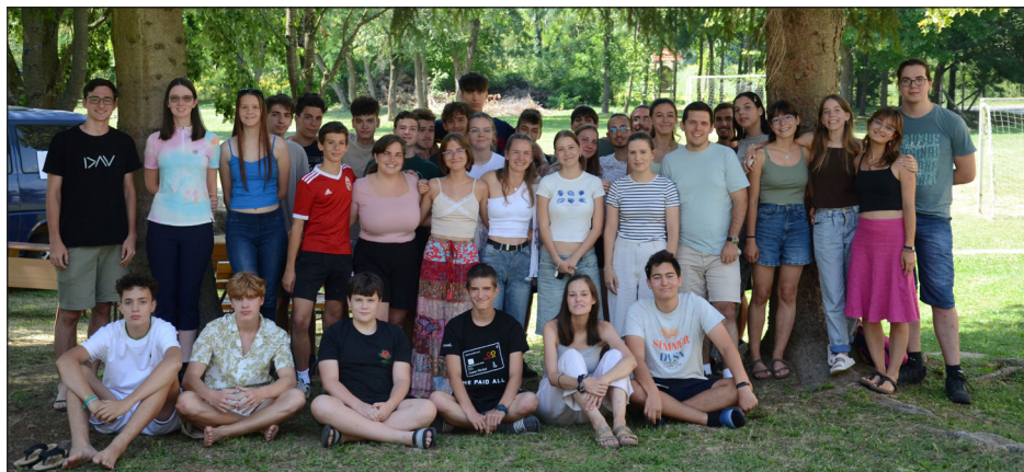
Az ifjtábor résztvevői - „Isten az, aki értelmet, célt tud adni az életünknek.”

A hét hátralévő részében tovább mélyítettük a témánkat. Paul Tillich német evangélikus teológus írt könyvet Létbátorság címmel. Tillich megnevezi azokat az alapvető alkotóelemeit az emberi létnek, amelyhez bátorságra van szükségünk. Ezek pedig a szívünket szorongató létkérdések. Így foglalkoztunk a szorongással, a mulandóság tapasztalatával, az élet értelmetlenségével és az elidegenedéssel. Az igében azt látjuk, Isten az, aki segít elfogadni a mulandóságot, és ugyanakkor meg is mutatja nekünk, milyen reménységünk van az örök életre. Isten az, aki értelmet, célt tud adni az életünknek. És a magányt és elszakítottságunkat is Isten vette magára Jézusban, hogy mi vele élhessünk közösségben. Táborzáró úrvacsorás is-