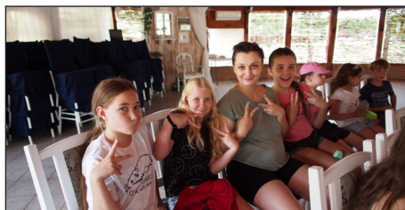
Korosztályok szerint négy csoportban tanulmányozták a napi igei történeteket.

„Isten Igéje”- téma köré rendeződtek. Sok jó, illetve fontos kérdés, hozzászólás érkezett a gyermekektől, amelyeknek kifejezetten örültünk. Nagyon szeretnénk, hogy az Úr személye és a megváltás is