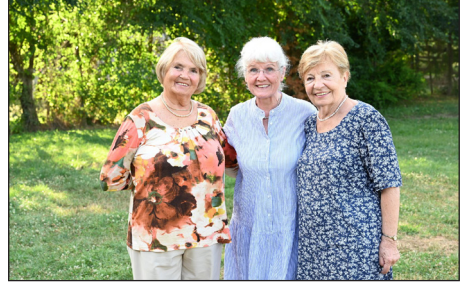
Sok áldást kaptunk a héten