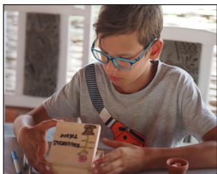
Jutott idő játéokra

Korosztályok szerint négy csoportban tanulmányoztuk délelőtt a napi történeteket, amik az