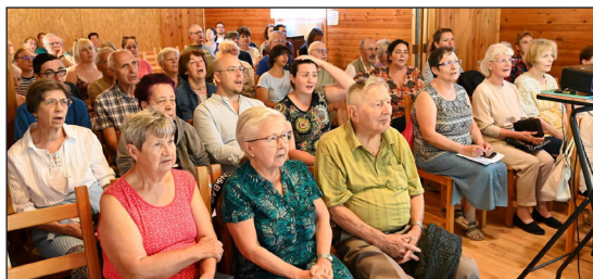
Az Igemagyarázatokat hallgatva lelkileg együtt épültünk.