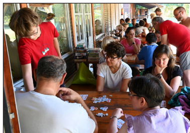
A társasjátékok által is „egybeszerkesztett” minket Isten.