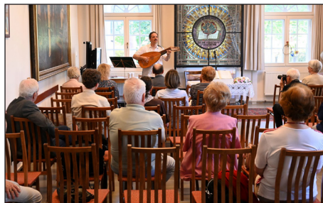
A hallgatóság örömmel fogadta a könyvbemutatón a zenei produkciót.