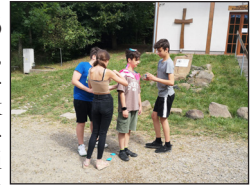
Jutott idő játékra, sportra

A derűs nyári idő lehetővé tette, hogy egyik délután kiránduljunk a környéken, felkeressük a közeli kilátót, ahonnan a Mátra lenyűgöző szépségű látkepe