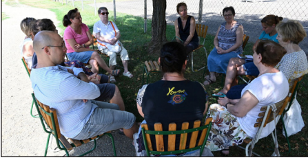
Az igékről és az Igemagyarázatokról csoportfoglalkoztáson is beszélgettünk