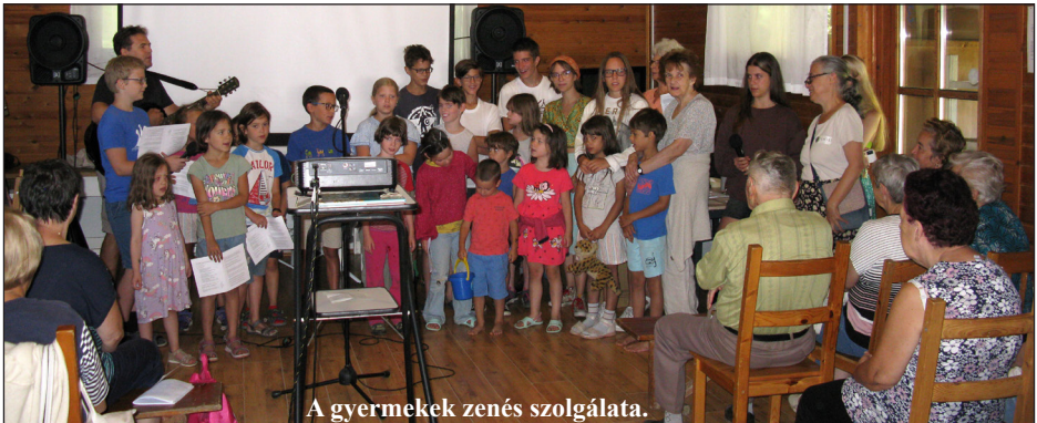
A gyermekek zenés szolgálata.