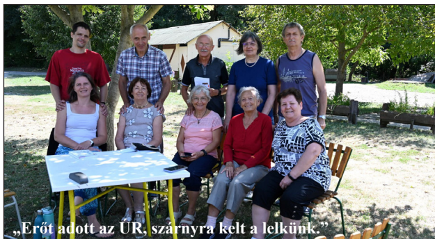
„Erőt adott az ÚR, szárnyra kelt a lelkünk.”

A fenti bizonyágtétel nyári csendeshetünkről szól. Arról, hogy kit, miként szólított meg az ÚR, az Ige, és milyen lelki ajándékokat kapott, beszámolunk a 32. oldalon kezdődő összeállításunkban olvasható.