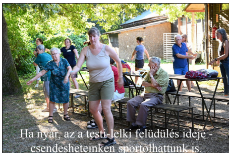
Ha nyár, az a testi-lelki felüdülés ideje - csendeseteinken sportolhattunk is.