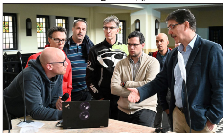
A szolgáltató csoport tagjai a beüzemeléskor technikai megbeszélést tartanak.

A leggyengébb láncszem a vezetékezés volt. Biztosan hallottak a Testvérek a felújítás előtt folyamatos halk zizegést a hangszórókból. Ez a gyenge minőségű vezetékezés következménye volt. Ezek a vezetékek a falakban futnak, cseréjükre eddig azért nem is gondoltunk, mert ehhez a falak megbontására lett volna szükség. Most, mivel a felújítás miatt erre eleve sor került, ezért eljött az ideje annak, hogy vezetékek-kérdés napirendre kerüljön. Erősítőink hangminőségével nem volt baj, de az évtizedek alatt megöregedtek, egyesével mondták fel a szolgálatot, javításuk alkat-