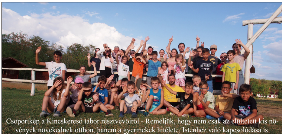
Csoportkép a Kincskereső tábor résztvevőiről - Reméljük, hogy nem csak az elültetett kis növények növekednek otthon, hanem a gyermekek hitélete, Istenhez való kapcsolódása is.