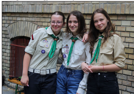
Virágzó a közösségi élet

A cserkészlet 1908-ban indult el, hazánkban 1910-ben. A világ több mint 200 országában 38 millió cserkésztestület egyesítő közösség fő célja, hogy segítse a fiatalokat, hogy a társadalom elkötelezett, felelős, egészséges polgáraivá váljanak. A Magyar Cserkészszövetség 300 csapatában körülbelül 10 ezer cserkész tevékenykedik országszerte.