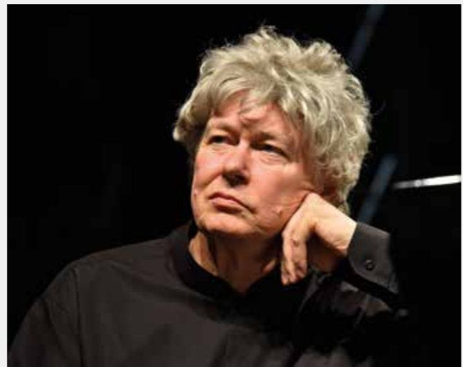
szerző, akiket életpályájuk, művészetük, tehetségük tesz híressé.

2004 januárjában a cannes-i Midem fesztiválon életműdíjat kapott, és átvehette a francia művészeti érdemrend lovagi fokozatát. 1978 után 2005-ben másodszer is Kossuth-díjjal tüntették ki. Bartók Béla születésének 125. évfordulóján másodszer kapta meg a Bartók Béla-Pásztory Ditta-díjat, 2007-ben a magyar kultúra követe lett, s jubileumi Prima Primissima díjjal is jutalmazták. 2012-ben Corvin-lánc kitüntetésben részesült, idén májusban vehette át a Magyar Olimpiai Bizottság Fair Play Bizottsága által megítélt Fair Play-díjat. Az előadóművészek közül elsőként ő lett a Széchenyi Irodalmi és Művészeti Akadémia rendes tagja.