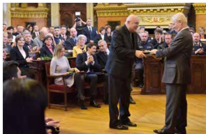
Végh Tamás lelkésznek Tarlós István főpolgármester gratulált

A megbecsülést nemcsak a sajátunknak érezzük, hanem mindenkiéne, aki ebben a nagyszabású programsorozatban részt vesz. Nem büszkeség, hanem őszinte és túlárado öröm tölt el bennünket, mert ez az elismerés még több emberhez eljuttatja az Ars Sacra Fesztivál hírért, és lehetőséget kínál számukra is szervezőként vagy látogatóként bekapcsolódni a lélekemelő, testvériséget és közösséget formáló programsorozatba” – fogalmaztak az alapítvány munkatársai.